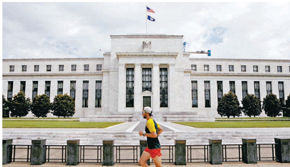
● 隨着美國聯儲局展開減息，預估市場資金將開始追尋更高收益機會，料有利於風險性資產的新興市場美元主權債。