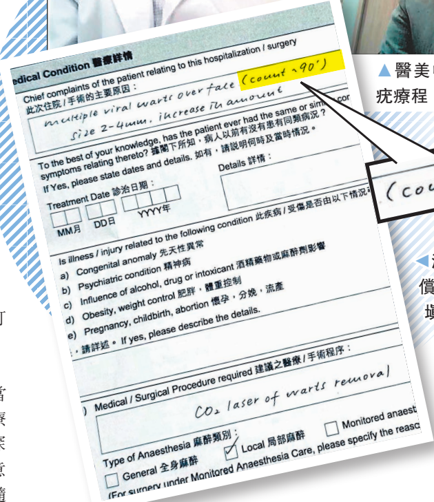
清楚見到該醫生在索償預先批核申請表上填上「90粒疣」。