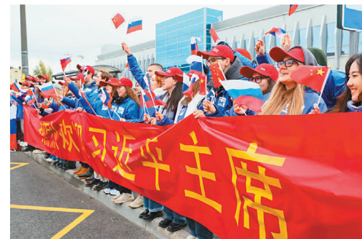
●當地時間10月22日中午，國家主席習近平乘專機抵達喀山，應俄羅斯聯邦總統普京邀請，出席金磚國家領導人第十六次會晤。這是歡迎人群。