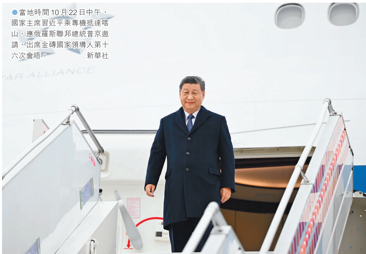
●當地時間10月22日中午，國家主席習近平乘專機抵達喀山，應俄羅斯聯邦總統普京邀請，出席金磚國家領導人第十六次會晤。