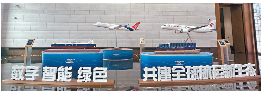
●北外灘國際航運論壇現場的飛機模型展示。