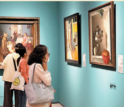
● 跨越500年歷史的56幅名畫此番來到中國首秀。