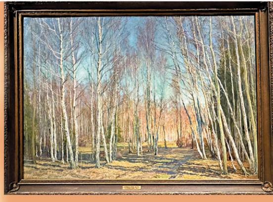
● 瓦西里·巴克舍耶夫的《春日》將白樺樹畫出了纖細又抒情的意味。