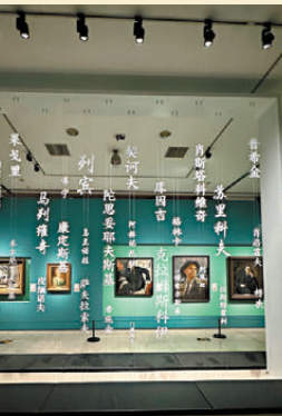
● 肖像畫是俄羅斯藝術的重要部分，列寧、高爾基、契訶夫、普希金等名人肖像畫悉數亮相。

這一單元中，也有部分名畫描繪的是普通人。19世紀上半葉傑出的藝術家之一瓦西里·特羅皮寧創作的《金繡女工》就巧妙地將肖像畫和風俗畫相結合。作為特羅皮寧風俗肖像畫的代表作之一，這幅畫特別巧妙地安排了女工手中布料的位置，使觀眾能夠清楚地欣賞到她的勞動成果，即花卉和菓子圖案。