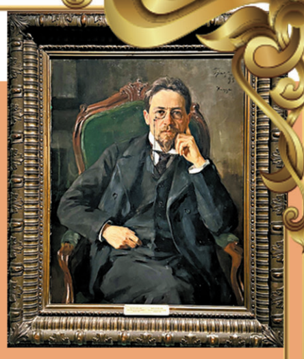
● 《作家契訶夫肖像》是契訶夫最著名的肖像畫之一。