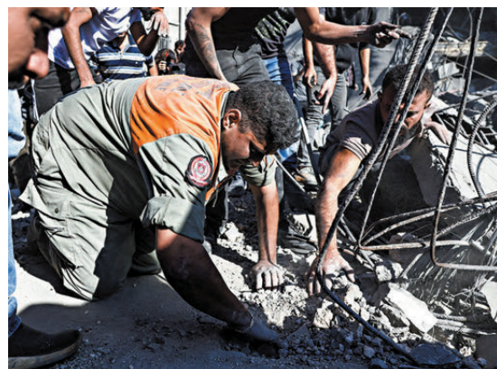
●黎巴嫩最大公立醫院附近建築遇襲，民眾搜救被困瓦礫下人士。