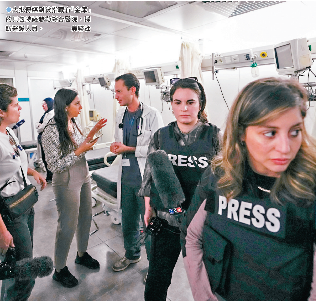
●大批傳媒到被指藏有「金庫」的貝魯特薩赫勒綜合醫院，採訪醫護人員。

敘利亞軍方周一發聲明，指首都大馬士革一輛汽車遭導彈襲擊，至少兩名平民死亡及3人受傷。哈加里稱在今次攻擊中，擊斃真主黨匯款部門負責人。