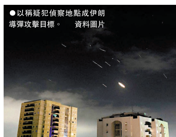
●以稱疑犯偵察地點成伊朗導彈攻擊目標。

過的最嚴重案件之一，這些疑犯主要罪名很可能是戰時通敵，刑罰是死刑或無期徒刑。」預計以色列檢方將在未來數天提出公訴。