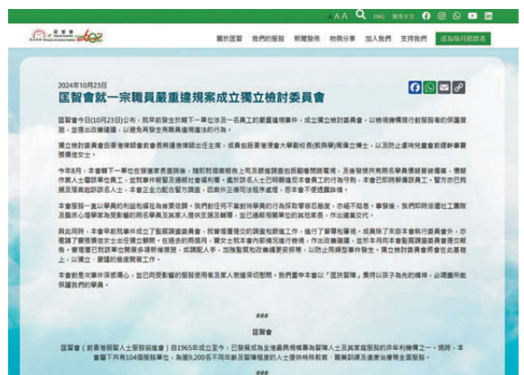
●匡智會昨日在官方網頁公布，已就一宗職員嚴重違規成立獨立檢討委員會。

社署回應表示，在知悉事件後隨即作出跟進，包括派員突擊巡查院舍，要求營辦機構嚴肅處理事件，並適切跟進兩名受害人及其家人的情緒和福利需要。社署亦知悉機構已成立獨立檢討委員會，檢視機構保護服務使用者的措施，期望檢討早日完