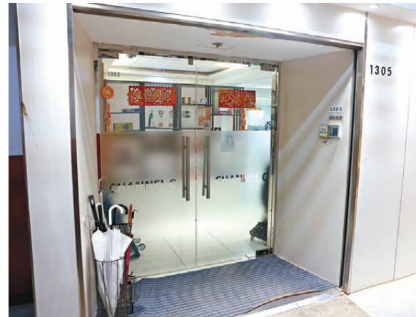
▲ Channel C 位於葵涌工廠的辦公室昨日仍有職員辦公。 Channel C 幕後金主陳智行早前曾被貼街追債。

資料顯示，去年6月 Channel C 在 YouTube 直播宣布「告急」，稱每月營運開支高達60萬港元，但會員訂閱數字並不理想，只有大約600人，連同廣告整體收入只有25萬元，資金僅夠營運1個月，如