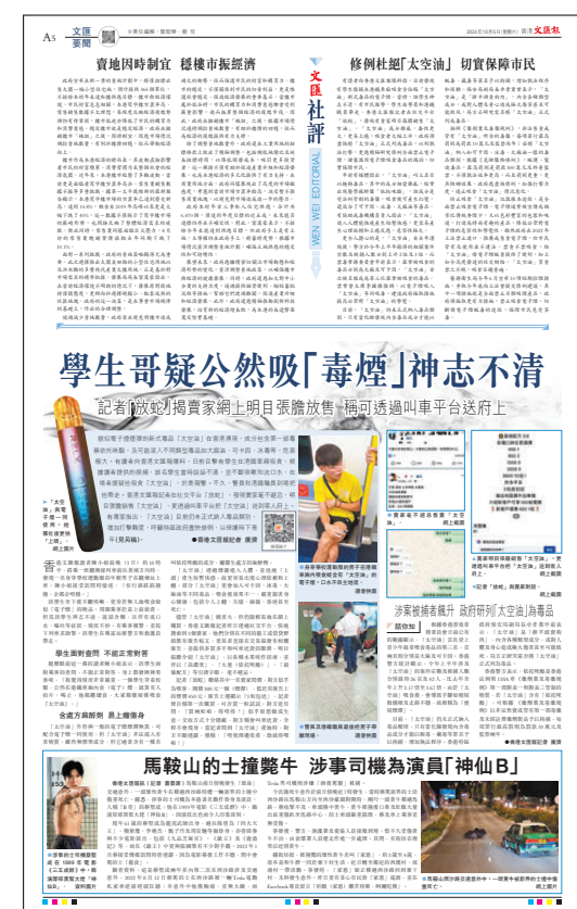
●本報10月5日A5版報道不法分子在社交平台公然販賣新式毒品「太空油」。

後向3名被告發送圖則，當中提到每一面屏幕重量217.6公斤，故每組雙面屏幕重435.2公斤，但該重量並不包括屏幕以外的金屬外框等配件。在辯方盤問下，楊同意涉案屏幕須組裝金屬外框，用以懸吊升降，而框架是由另一判商協興隆提供和設計。辯方問楊是否知道協興隆將機械組件和鋼索等項目外判給鈞龍。楊回應稱不清楚在 MIRROR 演唱會中協興隆與鈞龍的關係。辯方追問 ITP 有否直接與鈞龍溝通屏幕重量等數據，楊稱他本人沒有，又指其公司依主辦商藝能工程指示工作，與鈞龍不會直接合作。案件今日（24日）續審。 ●香港文匯報記者 葛婷