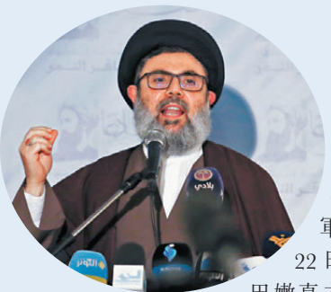
香港文匯報訊《以色列時報》報道，以色列軍方周二（10月22日）首次證實，黎巴嫩真主黨高級領導人薩菲丁（圖）已死亡。

以軍在聲明中稱，薩菲丁在10月4日對貝魯特南郊發動的一次襲擊中喪生，真主黨情報部門負責人哈齊馬也在這次襲擊中死亡。聲明顯