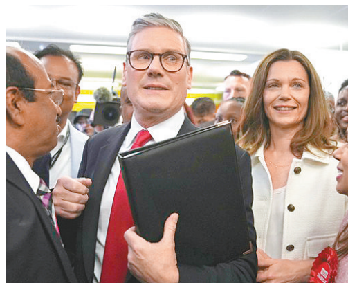
● 斯塔默否認這場爭端會影響他與特朗普的關係。

英國天空新聞指出，英國工黨和保守黨過往均曾替美國民主黨及共和黨官員助選。美國民主黨籍前總統奧巴馬的前顧問阿克塞爾羅德，曾於2015年幫助英國工黨前黨魁米利班德競選，奧巴馬另一名前競選助手梅西納則在同年協助時任保守黨領袖卡梅倫競選。多名資深英國保守黨成員尤其前首相特拉斯，也參加過多次美國共和黨的高規格活動，包括今年7月的共和黨全國代表大會。