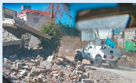
● 機密報告揭露以軍近期對聯黎部隊發動10多次襲擊。