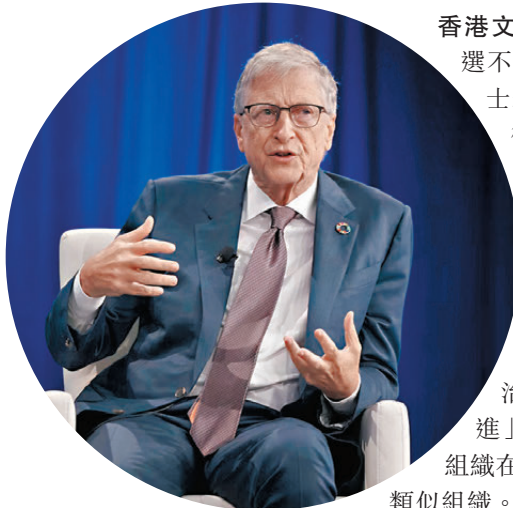
兼彭博社創辦人彭博討論，然後決定捐款。彭博為「未來前進」最大金主之一。

香港文匯報訊 距離美國總統大選不足兩周，愈來愈多知名人士表態支持對象人選，有傳微軟共同創辦人蓋茨（約）捐出5,000萬美元（約3.88億港元），給民主黨總統候選人哈里斯。