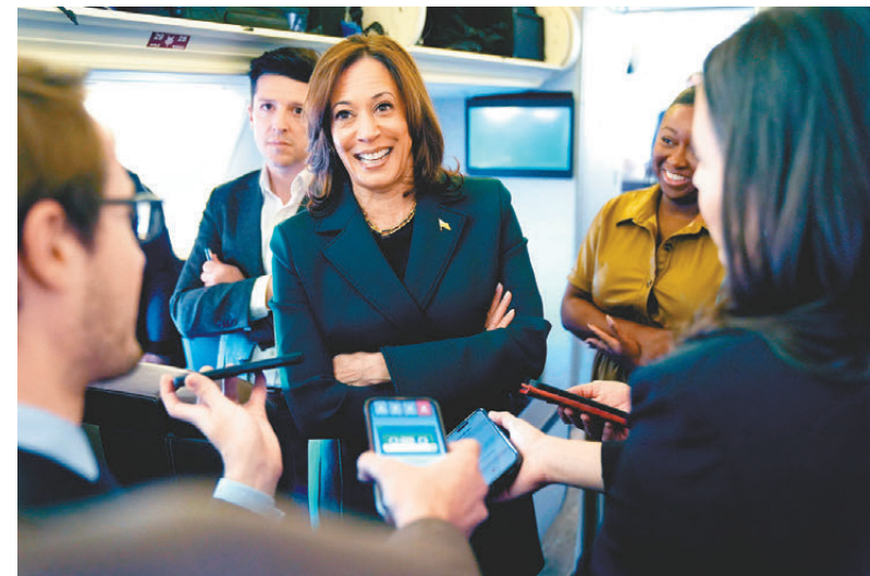
● 哈里斯稱自己的施政計劃能為拉丁裔男性創造更多發展機會。

香港文匯報訊 美國總統大選兩名候選人繼續積極造勢，爭取少數族裔選票。民主黨候選人哈里斯稱，美國已準備好迎來有色女性總統。共和黨的特朗普則在佛羅里達州，力爭拉丁裔選民支持。