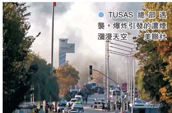
● TUSAS總部遇襲，爆炸引發的濃煙瀰漫天空。

TUSAS是土耳其國防工業的重要企業，項目包括生產土耳其首架國產戰機KAAN、無人機及引擎等，並為國際軍備項目生產零件。