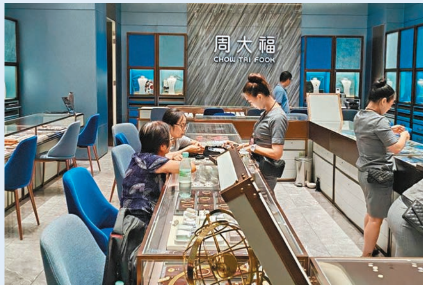
▲周大福店內諮詢價格的顧客。