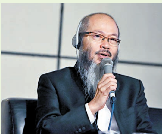
●陳世英認為，珠寶工匠需盡可能去學習不同領域的知識。圖為陳世英2016年作客香港書展。

作為當代中國最重要的珠寶藝術家之一，陳世英的珠寶創作寄情於山水，將中國傳統文化、哲學和智慧融入作品之中，在國際珠寶設計界獨樹一幟。日前，「千年萬念：陳世英半世紀珠寶藝術」展覽在上海博物館東館舉辦，展出《悟禪知翠》《王者歸來》等200餘件藝術傑作，是全球範圍內規模最大的陳世英個人藝術展。「東方氣韻」何以閃耀於世界珠寶藝術之林？東西方珠寶界如何通過「中西合璧」共謀未來？近日，陳世英在上海接受中新社專訪。