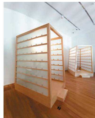
●《魚雁計劃》的小亭子邀請觀者入內寫信。 資料圖片