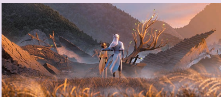
●《落凡塵》是由2020年鍾鼎執導的動畫短片孵化而成，也是廣州美術學院2020屆學生畢業設計作品。