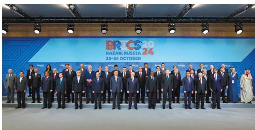
●當地時間10月24日上午，國家主席習近平在喀山會展中心出席「金磚+」領導人對話會並發表題為《匯聚「全球南方」磅礴力量 共同推動構建人類命運共同體》的重要講話。這是出席對話會的金磚國家及嘉賓國領導人或代表、國際組織負責人集體合影。新華社

香港文匯報訊 據新華社報道，當地時間10月24日上午，國家主席習近平在喀山會展中心出席「金磚+」領導人對話會並發表題為《匯聚「全球南方」磅礴力量 共同推動構建人類命運共同體》的重要講話。