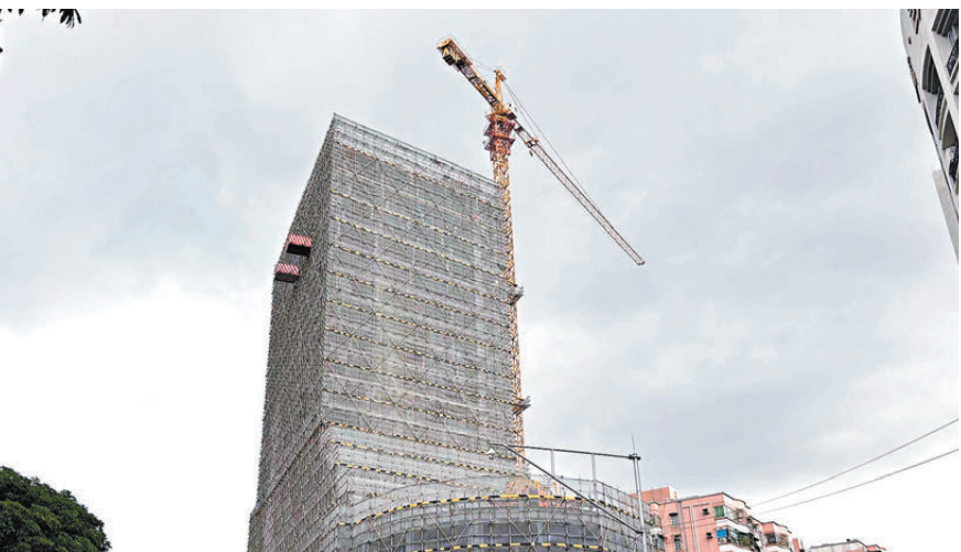
●3位建築師一致認為，內地城市更新和舊房改造，是香港建築師接下來的重要機遇。