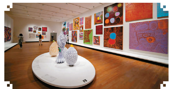
●2022年香港M+博物館舉辦草間彌生展覽。資料圖片

香港藝術品交易近年穩步增長。據政府統計處數據顯示，2023年香港藝術品、珍藏品及古董貿易總額1,054.65億元，較2019年的584.95億元高出超過80%，在整體貿易總額的佔比，由2019年的0.7%升至2023年的1.2%。香港藝術市場急速發展，與內地的龐大機遇息息相關。巴塞爾與瑞銀銀早發表報告表示，去年中國藝術市場銷售增長9%至122億美元，僅次美國成為全球第二大藝術市場，佔全球市場19%，亦是全世界唯一一個在藝術品交易高端市場實現增長的國家市場。