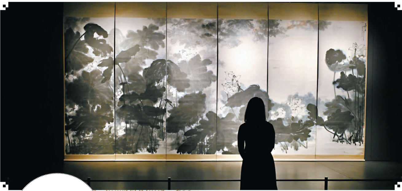
▲蘇富比於中環置地遮打的旗艦藝廊展出張大千《巨荷》六連屏。資料圖片