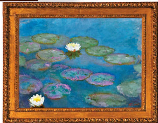
●莫奈《睡蓮》以約2.3億港元成交。

9月26日晚，克勞德·莫奈於125年前創作的《睡蓮》現身香港，領銜佳士得首場二十及二十一世紀晚間拍賣，這也是該作品在拍賣場的首秀，此前一直被莫奈家族所珍藏。該作最終以約2.3億港元成交。這幅作品被估價2億至2.8億港元，為「睡蓮」系列最早的作品之一。這組系列作品僅有8幅，有4幅現藏於博物館，因此極其