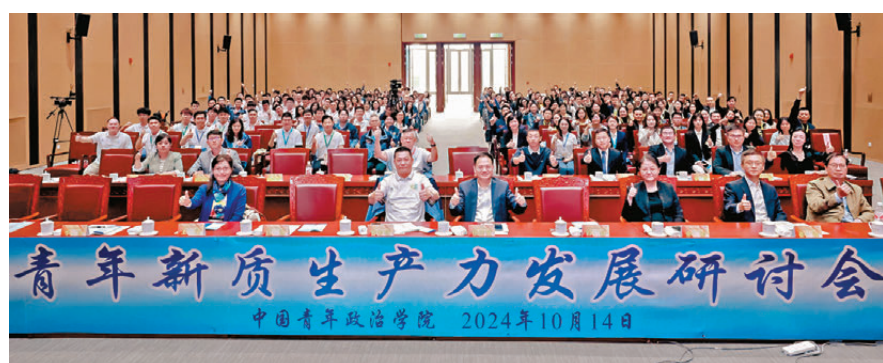
●明匯智庫在北京與中國青年政治學院聯合主辦「青年新質生產力發展研討會」。

香港文匯報訊（記者 子京）明匯智庫日前在北京與中國青年政治學院合辦青年新質生產力發展研討會。