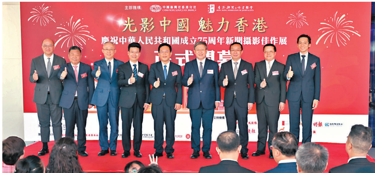
●「光影中國 魅力香港」慶祝中華人民共和國成立75周年新聞攝影佳作展昨日開幕，主禮嘉賓合照。