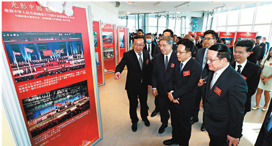
●展覽展出約150張新聞攝影作品，講述祖國的發展進步以及兩地血脈相連的故事。

是次展覽分為4個篇章，包括第一章「奠基歲月」記錄新中國成立後，全國人民昂揚奮發建設國家的壯闊征途；第二章「騰飛階段」展現改革開放後，中國經濟社會飛速發展的壯麗畫卷；第三章「復興新篇」聚焦中共十八大以來，社會主義現代化強國建設的磅礴征程；第四章「共同成長」，展示70年來，中新社香港分社與香港這顆「東方明珠」同呼吸、共命運的年華印記。展覽將持續至10月26日。