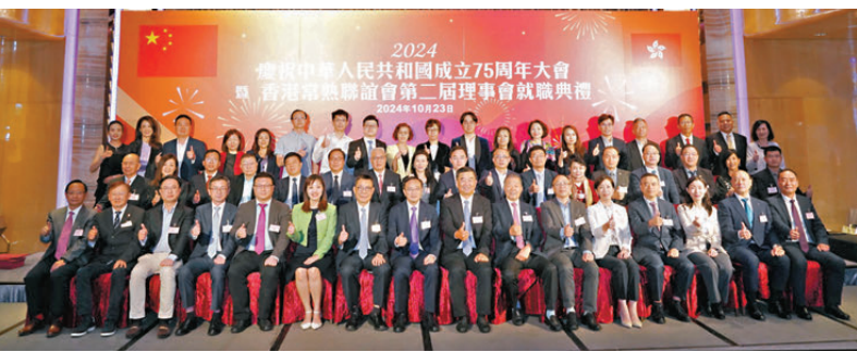
●香港常熟聯誼會第二屆理事會就職典禮。

示，常熟有很多科技人才，經濟實力也十分出眾，希望兩地增強在科技領域上的交流往來、攜手並進，為香港、為江蘇、為國家的科技實力貢獻更大力量。