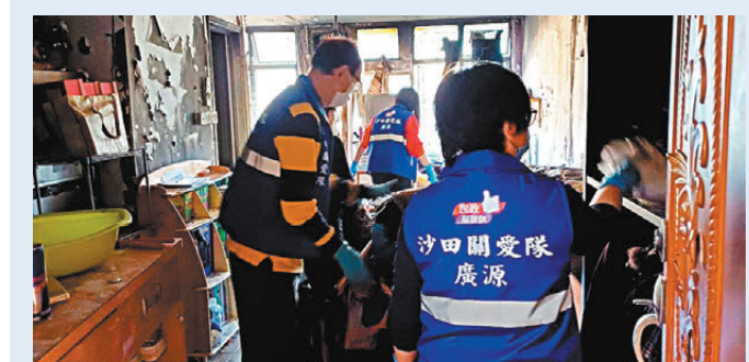
●新春期間，沙田廣源關愛隊到涉事單位幫助受火警影響的居民，協助處理善後工作。

是次活動得到國務院港澳事務辦公室、中華全國青年聯合會秘書處、中央政府駐港聯絡辦青年工作部指導，以及全國政協港澳僑務委員會辦公室、教育部港澳台辦公室、國家體育總局外聯司、雙智基金、中國青年政治學院教育基金會等有關方面的大力支持。