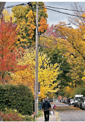
加拿大秋色，並非單一紅、黃、橙、殘綠，還有黃金似的金黃，走在路上猶似步入油畫境界。