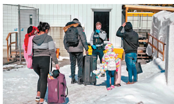
杜魯多政府將宣布將2025年吸納永久居民目標人數減至約39.5萬。

杜魯多回應說，他領導的自由黨依然「強大而團結」，同時表示他需要一些時間「進行反思」，據報他可能決定繼續擔任黨魁。根據加拿大法律規定，若黨團中至少20%議員簽署請願，即可觸發領導審查。在此程序中，黨團成員將透過秘密投票，決定是否保留現任黨魁，若多數議員投票反對，黨魁將被罷免。自由黨在下議院共有153席，意味至少需約30名議員簽名，才能啟動這項審查程序。