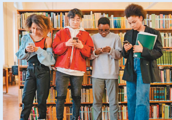
挪威政府擬將使用社交媒體的年齡提高至15歲。

挪威媒體報道，目前雖然有13歲的禁令，但挪威有53%的9歲兒童、58%的10歲兒童與72%的11歲兒童，都在使用社媒。