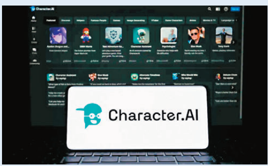
Character.AI 表示現時就AI聊天機械人推出新的安全功能，引導自殺傾向用戶撥打預防自殺熱線。

Character.AI 就訴訟表示，公司為一名用戶不幸離世深感痛心，公司現時就AI聊天機械人推出新的安全功能，如果用戶表達自殘或自殺傾向，系統會引導用戶撥打預防自殺熱線。研發團隊也會調整AI對話內容，降低未成年用戶遇到敏感內容的機率。