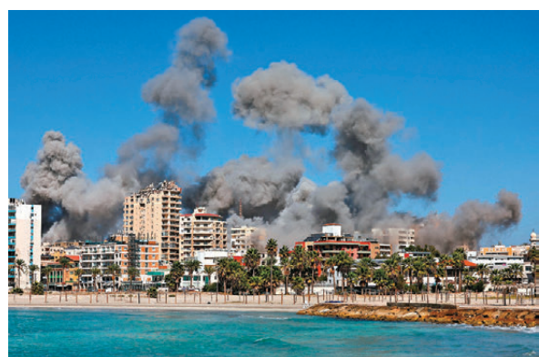
以軍空襲黎巴嫩南部擁有2,500年歷史的港口古城提爾。

精準導彈和新型無人機，打擊目標是以色列特拉維夫郊區一間軍工廠。以軍證實有4枚飛行物從黎巴嫩發射，攔截了其中兩枚，一枚落入空曠地區，另一枚落入特拉維夫郊區，無迹象顯示有防禦設施被擊中。