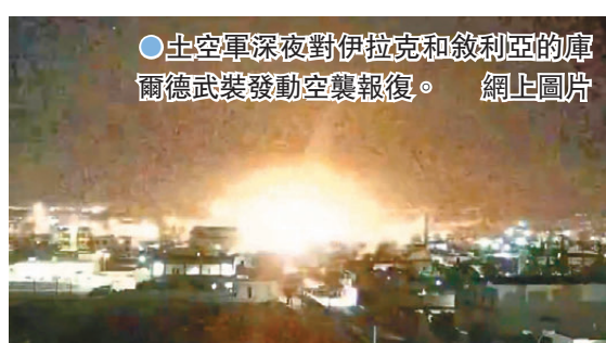
土空軍深夜對伊拉克和敘利亞的庫爾德武裝發動空襲報復。

庫爾德工人黨成立於1979年，尋求透過武力在土耳其與伊拉克、伊朗和敘利亞交界處的庫爾德人聚居區建立獨立國家，被土耳其列為恐怖組織。土耳其指「人民保護部隊」是庫爾德工人黨在敘利亞的分支，同樣屬恐怖組織。近年來，土軍多次越境打擊伊敘境內的庫爾德武裝。