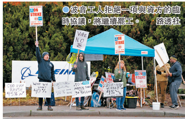
波音工人拒絕一項與資方的臨時協議，將繼續罷工。

分析師指出，工人們拒絕臨時協議繼續罷工，將加劇波音財務困境，估計一些波音最暢銷的機型因罷工而停產，將為公司帶來每月10億美元(約77.7億港元)虧損。