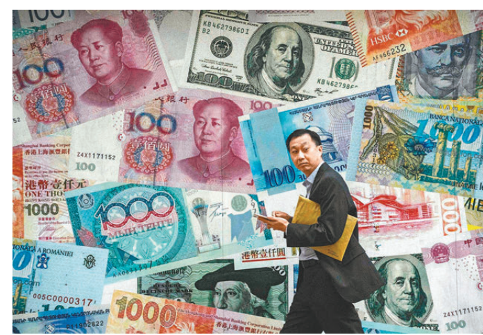
●CFA協會調查指多數投資者預期「美元最快5年將喪失儲備貨幣地位」。圖為香港一銀行外牆。

有關儲備貨幣多樣化及貿易金融系統的討論，儘管美元仍是全球主導貨幣，但亞太地區投資者或需考慮這些發展在未來幾年對其投資組合的影響。