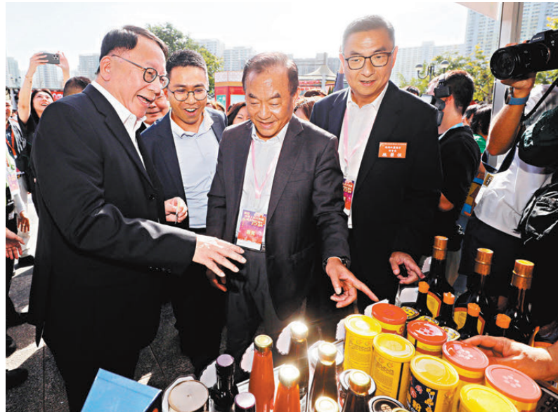
政務司司長陳國基逛市集，大手掃貨。