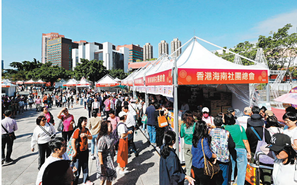
國慶市集設有75個攤位，提供來自全國各地家鄉特產。