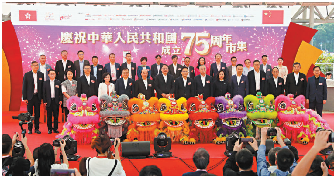
慶祝中華人民共和國成立75周年市集昨日在沙田公園開幕。圖為嘉賓在開幕儀式上合影。

一連5天的慶祝中華人民共和國成立75周年市集由25日至29日在沙田公園舉行，75個攤位提供來自全國各地平、靚、正的家鄉特產、美食、傳統工藝品和歌舞表演，市民可免費入場。特區政府政務司司長陳國基在昨日啟動禮上致辭時表示，是次國慶市集由民政總署與28個省級同鄉社團攜手合辦，展示各省市獨特的飲食和風俗文化。他指出，同鄉社團一直在香港的發展歷程中擔當重要角色，發揮橋樑作用，期望各個同鄉社團繼續充分利用廣闊的網絡，推動香港與內地省市交流合作，並與特區政府合力打造香港成為高端人才的聚集地，讓香港發揮好「超級聯繫人」和「超級增值人」的優勢，為國家擴大對外開放、實現高質量發展貢獻力量。