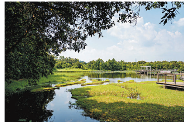
● 建立濕地保育公園系統能為北部都會區發展創造環境容量，締造保育與發展並存。 資料圖片

發言人強調，維護國家安全是所有主權國家的固有權利，很多普通法司法管轄區，例如美國、英國、加拿大、澳洲及新西蘭等西方國家和新加坡等，都制定了多部維護國家安全的法律。如對此視而不見，抹黑香港國安法及有關條例，是徹徹底底的雙重標準。