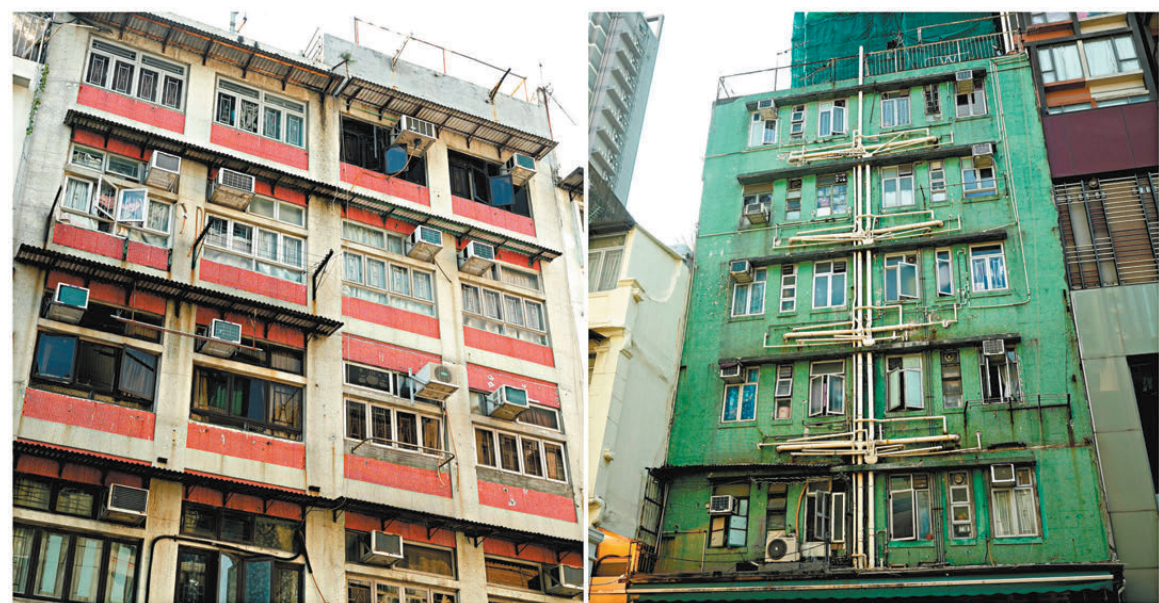
● 順頤樓(左)和龍威大廈(右)成為首批由市區重建局及香港房屋經理學會安排試行「聯廈聯管」管理模式的廈宇。

香港文匯報訊 為進一步改善樓宇安全和大廈管理，新一份施政報告提出明年會於選定小區推行「聯廈聯管」試驗計劃。事實上，市區重建局及物業管理業監管局認可專業團體——香港房屋經理學會正於九龍城「龍城」試行「聯廈聯管」管理模式。成功投得合約的管理公司表示，在未「進場」前已協助業主解決部分問題，並計劃日後引入先進科技為兩幢大廈提供服務，提升物管服務效率並節省成本。