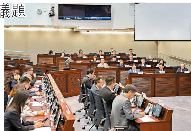
● 立法會議員與西貢區議會議員就加強打擊區內非法餵飼野鴿的執法行動交換意見。

在與九龍城區議會舉行的會議上，立法會議員與區議會議員討論及交流意見的議題包括啟德整體發展規劃，涵蓋啟德體育園在2025年首季啟用的籌備工作和交通安排、啟德智慧綠色集體運輸系統項目的推展工作，以及啟德郵輪碼頭的使用情況；關注土瓜灣體育館擬重置為劍擊館，以及貫通紅磡黃埔、土瓜灣、啟德的