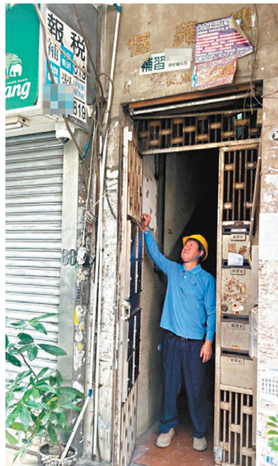
● 得悉順頤樓大廈出入口的門鼓有問題後，公司隨即安排維修人員更換，解決大廈保安問題。

張玉龍補充，該公司計劃引入先進科技為兩幢大廈提供服務，提升物管服務效率並節省成本。早前，該公司開發了智慧巡邏系統，除了方便物管人員透過智能手機在物業內不同地方巡邏外，