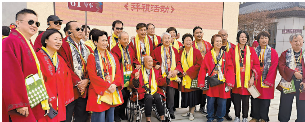
▲鄉親出席拜祖大典活動。