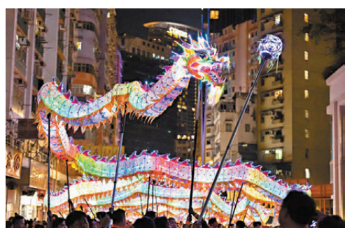
●11月3日舉行的大角咀廟會將有夜光龍表演。

香港文匯報訊 由信和集團及黃廷方慈善基金支持、旺角街坊會主辦、油尖旺民政事務處協辦及贊助的大角咀廟會,將於11月3日上午10時至晚上9時30分在大角咀福全街舉行。今年廟會以慶祝中華人民共和國成立75周年為主題,活動包括近千人參與的廟會特色巡遊、18隻醒獅梅花樁表演、模特兒華服時裝秀、千人盆菜宴、50多檔小食和特色產品攤位,全港最長500呎LED夜光龍和國家級非物質文化遺產