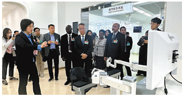
●外國駐港領團和商界參訪團參觀威高集團。

香港文匯報訊(記者 丁春麗 威海報道)外交部駐港公署特派員崔建春率領的外國駐港領團和商界參訪團走進山東威海,重點考察威高集團、迪尚集團以及全球打印機產業基地,感受中國智能製造的硬實力。