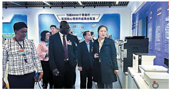
●外國駐港領團和商界參訪團參觀威海全球打印機產業基地。

海。」在威海全球打印機產業基地,工作人員介紹說,屆時打印機產能將突破3,000萬台,這裏將成為名副其實的「全球打印機之都」。目前,僅有4平方公里的全球打印機產業基地,卻集聚了惠普、捷普、富士康、聯想、華為、富士6家世界500強企業以及香港億和精密、帝吉可、富康電子等110多家整機及配套企業。2023年整機產出1,600萬台,產值突破400億元,佔全球打印機產能六分之一。