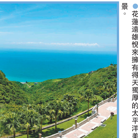
●花蓮遠雄悅來擁有得天獨厚的太平洋美景。