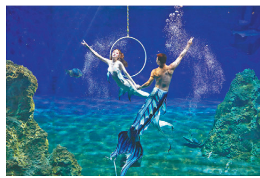
●遠雄海洋公園美人魚實境秀表演撼動人心。

今年冬天，遠雄海洋公園推出聖誕節的主題限定旅行，由12月7日至明年1月19日為繽紛溫馨「藍色海洋聖誕」，搭配節慶主題餐點與情境布置，讓遊客沉浸在濃厚的節日氣氛中。斥資百萬台幣升級成劇場型態的嶄新美人魚秀，優美的歌聲、燈光舞台效果加上充滿異地風情的華麗服飾，唯美浪漫的世界級專業演出，演出結束後還能與美人魚一起坐在夢幻大貝殼內互動合照。