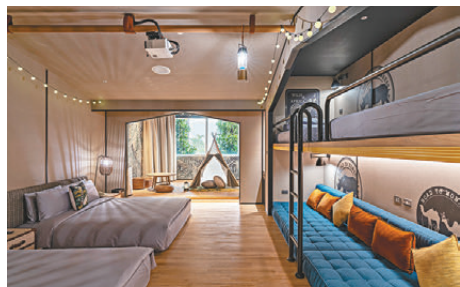
●親子野奢主題房型

各年齡層都會玩瘋的Rich Fun瑞奇活力館，全新遊戲室結合網美休憩娛樂空間，備有健身房、兒童遊樂設施、互動投影牆、DIY手作課程等空間。無邊際的海景泳池，不論戲水、觀海，恣意享受池畔日光浴好滿足。此外，大片落地窗的「英倫西餐廳」採用自助餐的模式，餐檯豐富、選擇多元，還有特製小朋友的餐檯區。另一家「秋草鍋物料理」，則是主打能品嚐到花蓮在地優質食材，真正體驗花蓮風味，走進花蓮日常。