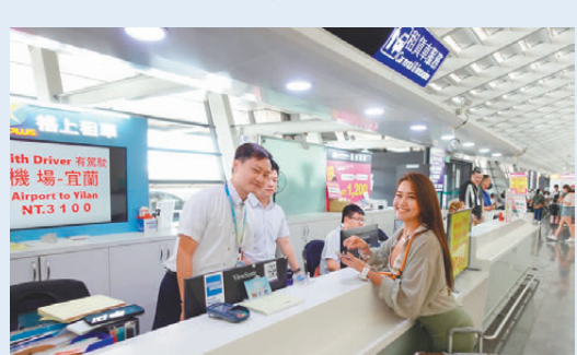
●格上租車在各大機場均設有櫃台。

香港是右軚駕駛地區，而台灣則是左軚駕駛，許多知名的風景區更是考驗駕駛技術的山路，所以近幾年許多港人大都選擇包車，舒適方便又安全。格上租車在台灣經營40年，為台灣租車業龍頭，他們具有三大優勢：車款新穎、司機專業服務好及追蹤行程保障旅客安全，今年他們擴大綠能車隊的規模，以台灣熱銷純電車LUXGEN n 3 讓旅客享受舒適感全面升級的低碳綠能旅遊。