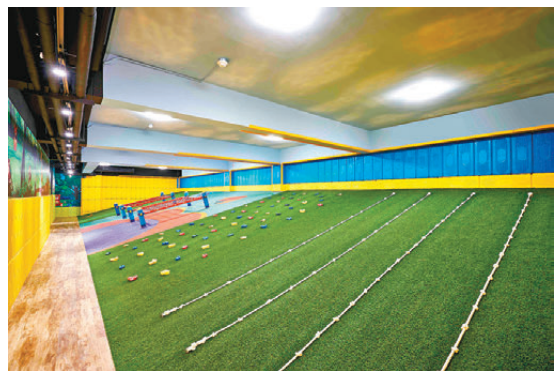
▲親子館有室內滑草攀岩等設施。