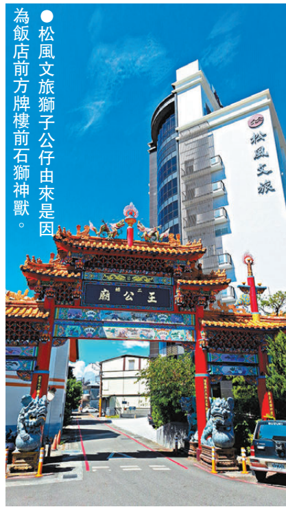
●松風文旅獅子公仔由來是因 為飯店前牌樓前石獅神獸。

雖然港人最常去台灣的地區仍然是台北，但位於台灣東部的宜蘭、花蓮、台東有台灣後花園之稱，不同於香港和台北那樣繁華熱鬧、高樓林立的大都市，宜花東則有着療癒的田園風情和壯麗的山海美景，選家好飯店搭配包車旅遊，一出機場就開始享受賓至如歸的服務，不用擔心交通問題，邊欣賞沿途風景就抵達，也能輕鬆採買伴手禮。這次推薦給大家台灣較為優質的包車服務品牌、宜蘭及花蓮區住宿，以及必買的伴手禮，讓大家輕鬆探索台灣宜花東之美！