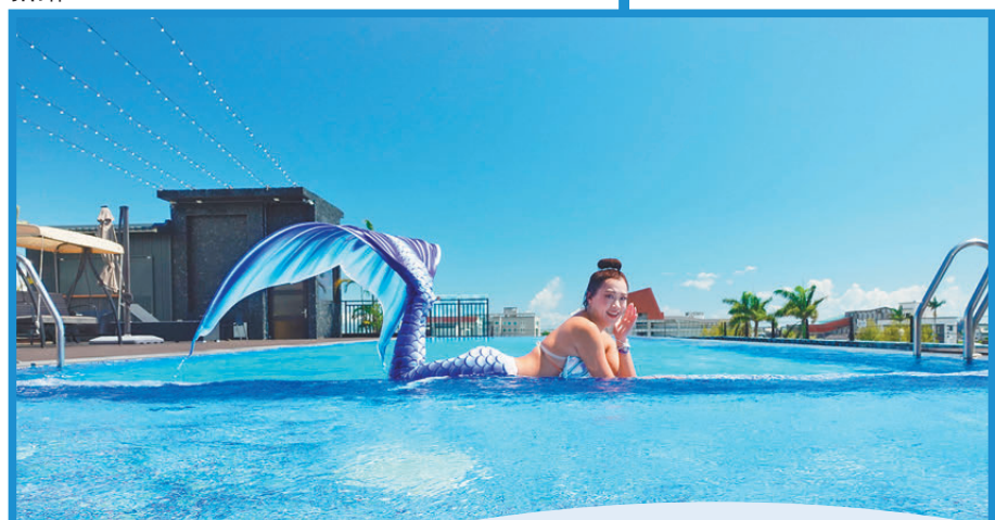
▼飯店會安排專業的美人魚在泳池中悠游供大家拍攝。