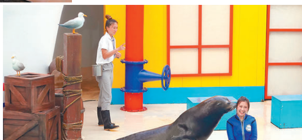
●親親海獅的體驗活動感受跟海獅的親密接觸。