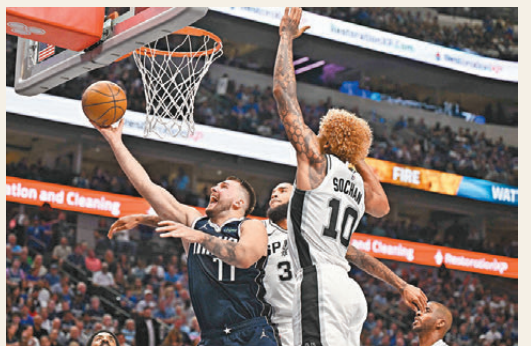
●當錫(左)新賽季有好開始。

香港文匯報訊 綜合外電報道，美職籃(NBA)新賽季常規賽繼續進行，達拉斯獨行俠拿到開門紅。當錫交出28分10個籃板和8次助攻的表現，基利湯遜亦在加盟後常規賽首演中得到22分和7個籃板，兩人率隊以下半場強勁攻勢確立大比數領先，獨行俠最終在主場以120:109大勝聖安東尼奧馬刺。