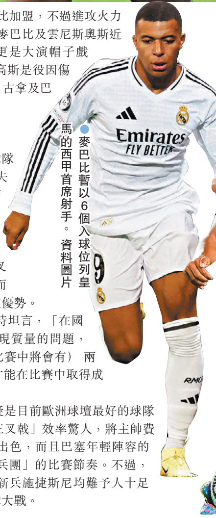
●麥巴比暫以6個入球位列皇馬的西甲首席射手。資料圖片

論狀態，今季由費歷克接手執教的這支巴塞無疑是目前歐洲球壇最好的球隊之一，由利雲度夫斯基、拉芬夏和耶馬組成的「三叉戟」效率驚人，將主帥費歷克強調行軍速度及反擊效率的戰術執行得十分出色，而且巴塞年輕陣容的活力亦在皇馬之上，皇馬是役未必能跟上「紅藍兵團」的比賽節奏。不過，由於達史特根重傷長休，門將位置無論是彭拿或新兵施捷斯尼均難予人十足信心，兩隊攻強於守之下或會上演一場門攻的入球大戰。