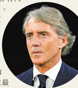
●文仙尼帶領沙特隊成績欠理想。資料圖片

香港文匯報訊 綜合新華社報道，沙特阿拉伯足總當地時間24日宣布，經協商，與男足主教練文仙尼解約，有報道指，沙特足總向文仙尼支付了一筆高昂的違約金。在去年8月離開意大利男足帥位後不久，文仙尼便在沙特走馬上任。然而，這位名帥的成績並不能令沙特足總滿意，在執教的18場正式比賽中僅獲得7場勝利，在最近一場世界盃外圍賽18強賽上，沙特隊與巴林隊戰平後，文仙尼甚至與看台上的球迷發生爭吵。18強賽四輪過後，日本隊以10分領跑，澳洲、沙特和巴林隊同積5分，印尼隊和中國隊同積3分。根據規則，小組前兩名將直接晉級世界盃，三、四名將參加附加賽。