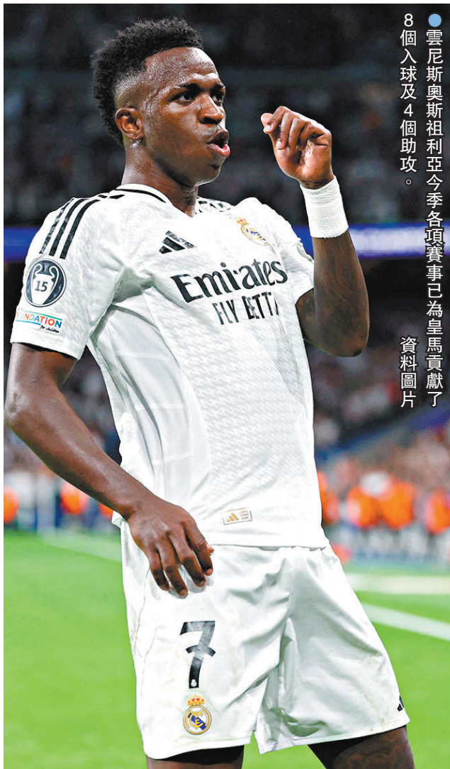
●雲尼斯奧斯祖利亞今季各項賽事已為皇馬貢獻了8個入球及4個助攻。