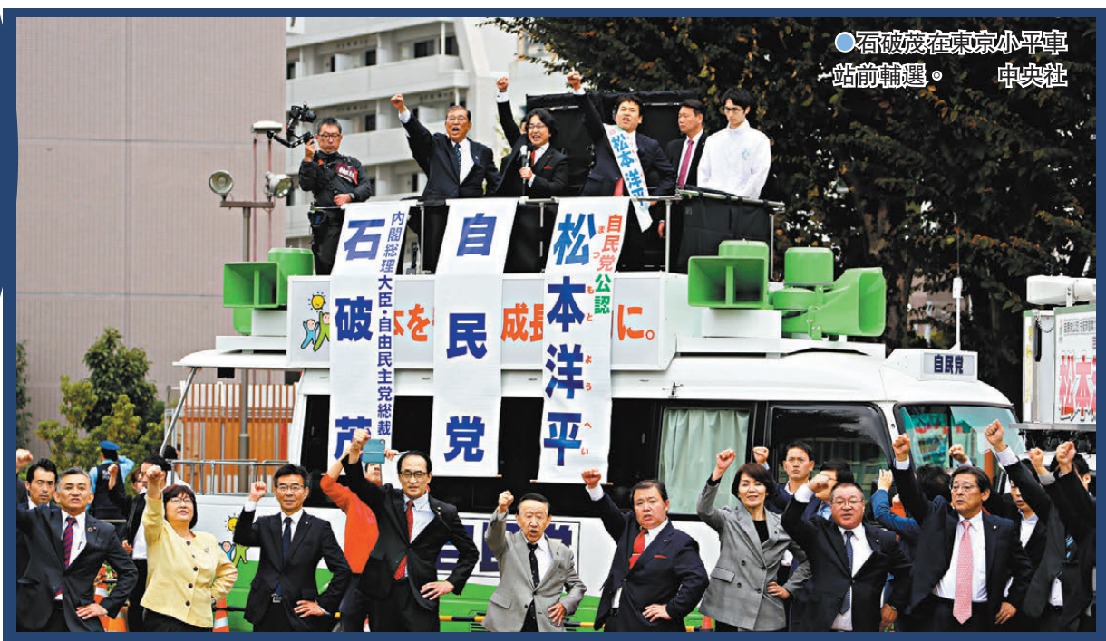
●石破茂在東京小平車前慶祝。

香港文匯報訊 日本眾議院選舉於剛過去周日(10月27日)舉行，出口民調已確認執政自民黨無法單獨取得過半數議席，日本放送協會(NHK)更指即使加上盟友公明黨的議席亦不過半數。選前分析指出，日本民眾對自民黨政治獻金醜聞深感不滿，物價攀升、經濟停滯亦令選民擔憂。拜相不足一個月的自民黨黨魁石破茂，未來施政勢受掣肘，預料需拉攏反對派陣營的議員支持。