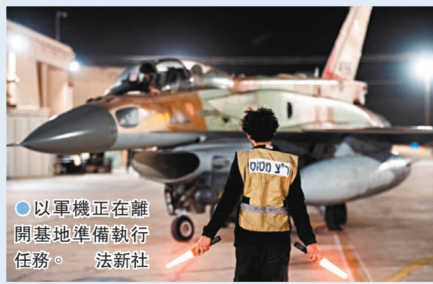
●以軍機正在離開基地準備執行任務。

另一方面，在以色列特拉維夫北部城鎮格利洛特，一輛貨車周日撞向一個巴士站，造成約50人傷。據悉貨車司機為阿拉伯裔人，他在事後被當地人射殺。由於格利洛特地區是以情報機構摩薩德總部所在地，警方懷疑事件為恐襲。