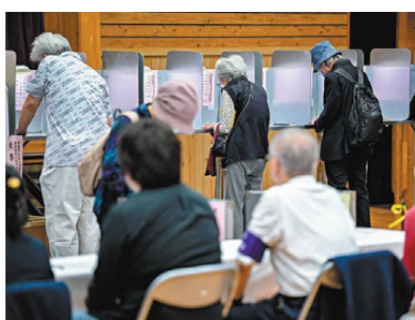
●日本執政自民黨在今屆眾議院選舉選情不利。 法新社