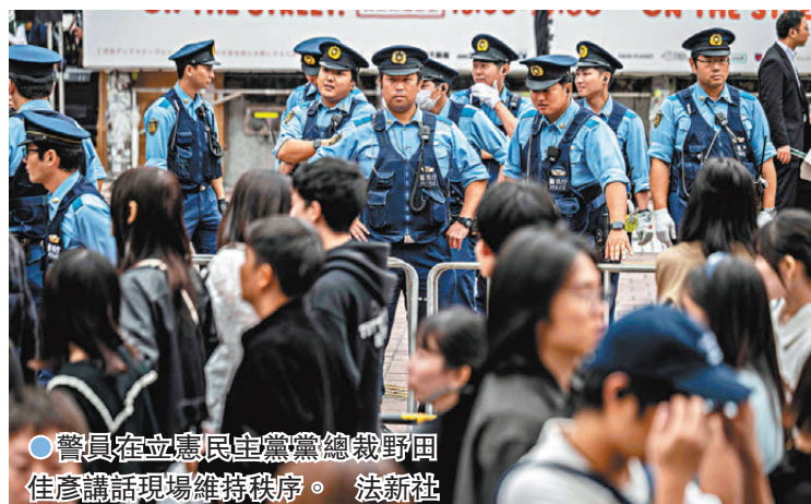
●警員在立憲民主黨總裁野田佳彥講話現場維持秩序。

分析指出，石破茂本月初就任後，短短8天便解散眾議院舉行選舉，強調此舉旨在令自民黨更好地爭取民眾信任、使民眾支持新政府的政策。然而依照選舉結果，石破茂若未來繼續施政，其黨內地位可能會被削弱，在黨總裁選舉中險勝的他，更可能面臨黨內逼宮，有機會成為戰後任期最短的首相。石破茂周日晚表示，在執政黨議席數不過半的情況下，或與在野黨合作，並強調會繼續擔任首相。