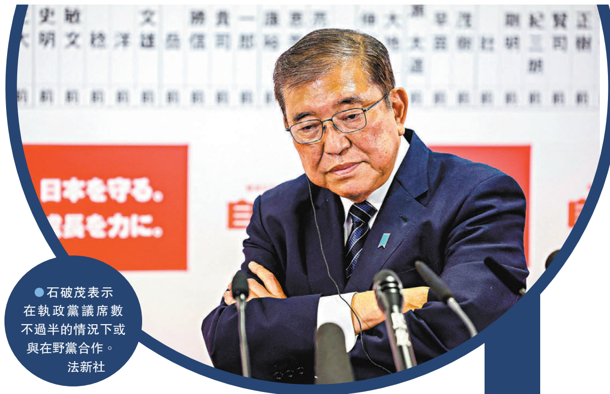
●石破茂表示在執政黨議席數不過半的情況下或與在野黨合作。