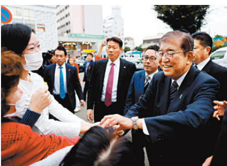
●首相石破茂的累計拉票出行距離為1.1萬公里，共造訪23個都道府縣。

日媒《每日新聞》社論分析，通常而言投票率偏低，對執政黨更有利，不過今屆選舉中，自民黨深受政治獻金醜聞困擾，選民們可能希望透過投票，直接實現政權交替。