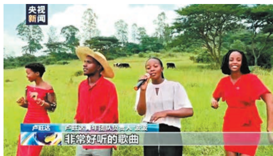
● 最近，一支來自非洲盧旺達的樂隊憑借演唱多首優美動聽的中文歌在網絡上掀起熱潮。他們帶着盧旺達人的熱情，傳播中國文化，演繹一段有關中非文化交流的佳話。網上圖片

習近平指出，要在創造性轉化和創新性發展中廣續中華文脈。高揚中華民族的文化主體性，把歷史滄桑留下的中華文明瑰寶呵護好、弘揚好、發展好。深入挖掘和闡發中華優秀傳統文化的精神內涵，用馬克思主義激活中華傳統文化中的優秀因子並賦予其新的時代內涵，發展新時代中國