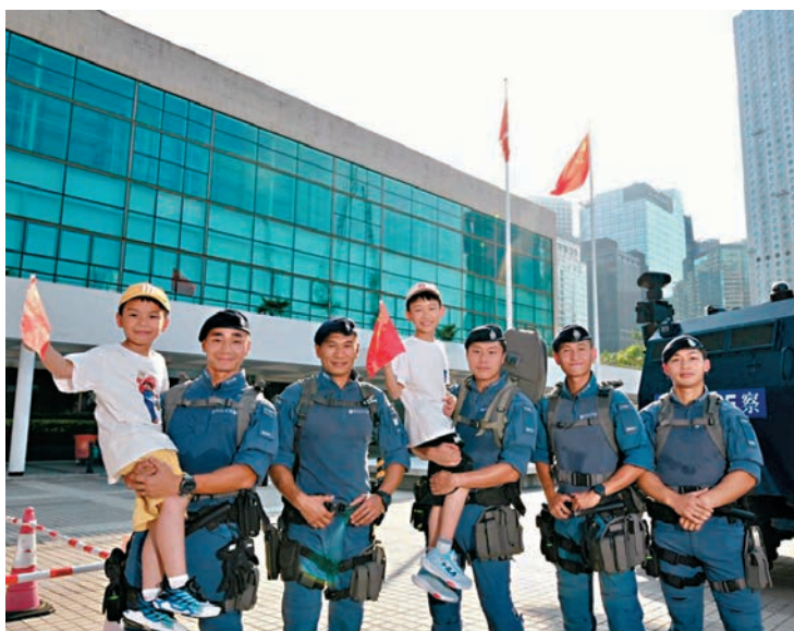
●調查數據顯示，青少年對警隊的評分比2021年增加近15分。