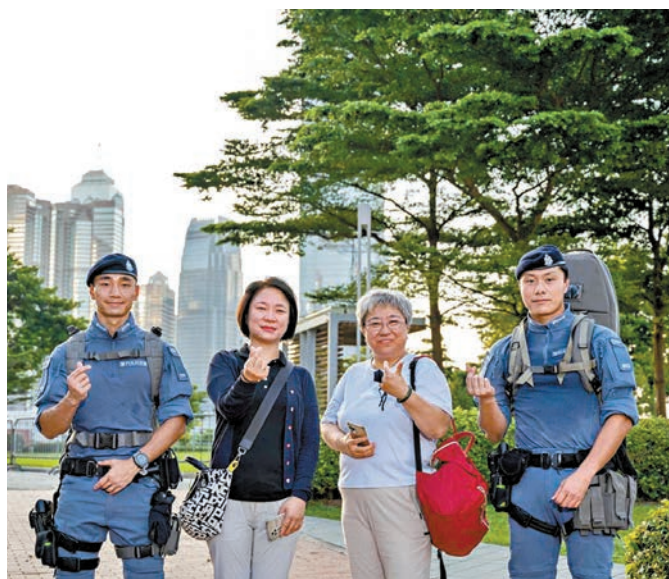
●逾六成受訪市民對警隊抱有信心。