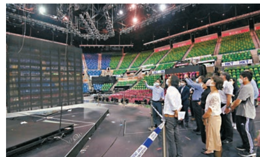
●當日跨部門工作小組人員到紅館調查意外原因。

辯方續指溫於2022年7月24日到紅館實地視察，當時有舞蹈員在採排，燈光較暗，而溫只