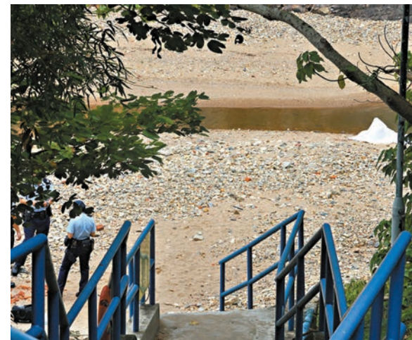
●警方前日在香港仔瀑布灣公園用白布遮掩女死者遺體進行調查。

香港文匯報訊(記者 蕭景源)香港仔瀑布灣公園前日發現一名非華裔女子伏屍瀑布底，全身僵硬及頭部有遭重物襲擊傷痕，據悉死者是一名在港工作的印尼家庭傭工，港島總區重案組列作謀殺案跟進，並迅速鎖定一名外籍男子涉案，但警方發現他和妻子在案發後潛逃內地，於是通緝兩人，至昨日下午夫婦突由內地返港，在西九龍高鐵站被拘捕，丈夫涉嫌謀殺，其妻子則涉嫌協助罪犯。據了解，疑兇與女死者相識，正循多方面調查殺人動機，包括感情和錢財糾紛。