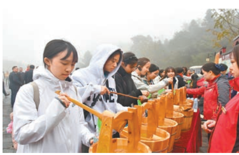
●本港中學生取東江源頭水，以作紀念。

蔡若蓮表示，教育局會繼續帶領學生進行以歷史文化、航空航天科技、鄉村振興、經濟發展和環境保育等主題的考察，進一步豐富他們的學習經歷。她期望學生珍惜難得的學習機會，把讀萬卷書與行萬里路結合起來，深入了解國家的歷史文化和現實國情，厚植家國情懷。贛州市委副書記、市長李克堅表示，此次活動能推動兩地教育事業高質量發展，增進老區人民與香港同胞一衣帶水的深厚感情，期望以此為契機，進一步深化贛港兩地教育交流，全力打造「老區+灣區」合作新典範。