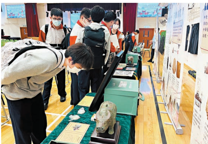
●「一字千金——中國漢字創意密碼」推介會暨豫港殷墟甲骨文文創新設計比賽香港校界說明會，昨日在港舉行。

香港文匯報訊（記者 劉蕊）「一字千金——中國漢字創意密碼」推介會暨豫港殷墟甲骨文文創新設計比賽香港校界說明會，昨日在香港信義中學舉行。此次推介會不僅是安陽文旅產業發展成果的一次重要展示，更是豫港兩地全面深入學習交流的寶貴機會。在簽約儀式環節，安陽與香港的旅遊界和教育界簽署了多項合作協議，標誌着兩地在文旅領域的合作邁上了新的台階。河南安陽市委書記袁家健致辭時，強調甲骨文作為中國最早成熟文字系統的重要性，以及安陽在傳承中華優秀傳統文化中的核心地位。他提到，安陽是國家歷史文化名城、中國八大古都之一，擁有超過3,300年的建城史，是世界文化遺產殷墟所在地。安陽以其豐富的文旅資源和深厚的文化底蘊，向世界展示了其獨特的魅力。推介會上，安陽文旅資源的推介成為了焦點。安陽以「字」為媒，為各地來客開啟了一段又一段文化之旅。今年國慶假期，安陽累計接待遊客762.75萬人次，同比增長79.81%，這一數據充分展示了安陽文旅發展的火熱勢頭。此外，與會嘉賓還體驗了甲骨文「字在田園」立體拼圖現場體驗拼裝活動、甲骨文十二生肖版印刷等互動遊戲，以及文創集市展示，現場氣氛熱烈，充分展現了安陽文創產品的多樣性和創新性。隨着舞台上演員們用身體擺出一個個甲骨文造型，舞台下的師生們踴躍舉手猜測這些甲骨文所對應的現代漢字，猜對的師生獲得了獨具特色的文創產品藝術品作為獎勵。在這樣的互動環節中，香港師生感嘆見識了「一字千金」，有文化必安陽，也表示想要親自來到安陽，深入了解文字之美，探索漢字起源。