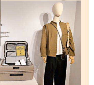
現在品牌已不再只是製造行李箱，還有多樣化的旅行產品。