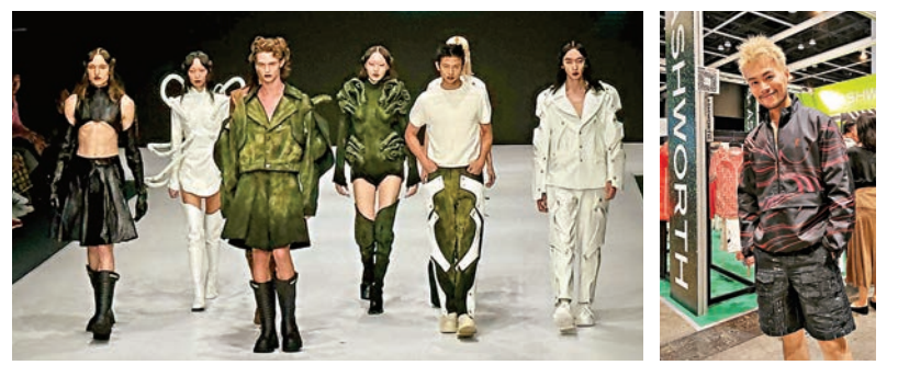
Fashion Hong Kong Runway Show 中新社 ●任朗呈與ASHWORTH x Mountain Yam 合作推出聯乘系列。