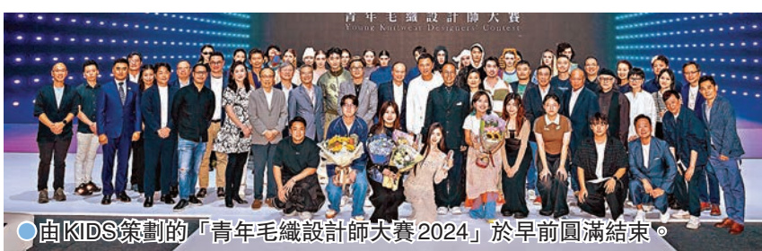
由KIDS策劃的「青年毛織設計師大賽2024」於早前圓滿結束。

由毛織創新及設計協會(KIDS)主辦的「青年毛織設計師大賽2024」已於9月6日在「CENTRESTAGE 2024」結束，今屆比賽首度開放予香港以外的粵港澳大灣區年輕設計師參賽，旨在向公眾及業界展現粵港澳三地設計師在毛織設計方面的創意與實力。總決賽當日共吸引超過600名現場觀眾入場觀賞，一眾業界人士及時尚名流亦有到場。