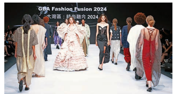
粵港澳大灣區時尚匯演2024——香港站

由 Fashion Farm Foundation (FFF) 主辦的「大灣區：時尚融合2024」，其中「粵港澳大灣區時尚匯演2024」是「大灣區：時尚融合2024」一場別開生面的時尚秀，早前在年度亞洲時裝盛會香港CENTRESTAGE登場，8個大灣區的優秀設計單位，包括4個來自香港、澳門和廣東的設計師品牌，以及4所設計院校的學生在伸展台上交出個人最新設計系列，創意力爆發，每一件作品都是一首行走的詩篇，服裝不僅是穿在身上的布料，還是一種藝術的表達，一種文化的傳遞。透過服裝的設計，展現出設計師獨特的藝術與時尚魅力。