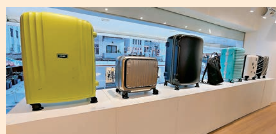
現場展示不同年代的行李箱。