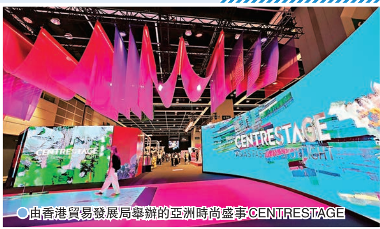
由香港貿易發展局舉辦的亞洲時尚盛事CENTRESTAGE

今年6月，「文創產業發展處」成立，目的是透過產業導向推動業界發展，其中對香港時裝設計界資助了不少時裝設計項目，帶動時裝設計的發展，讓大眾進一步認識香港時裝設計師。今年9月，由香港貿易發展局舉辦的亞洲時尚盛事CENTRESTAGE（香港國際時尚匯展）中，展會匯聚來自18個國家及地區、超過250個品牌參與，品牌數目為歷屆之冠。政府施政報告提出，把全新旗艦「香港時裝設計周」發展為年度盛事，打造香港成為亞洲時裝設計中心。「香港時裝薈巡禮」日前舉行，為首年度「香港時裝設計周」揭開序幕，於11月中開始將有一系列「香港時裝薈」活動，吸引世界各地時裝設計業代表和公眾人士參與。