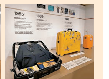
從1990年代到2000年代的初始系列產品