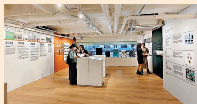
與LOJEL同行35年：時光之旅