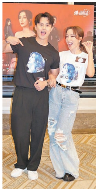
何廣沛再與視后合作，他直言相當感恩。