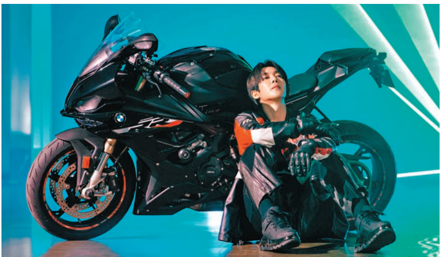
金賢重冬至香港開唱。