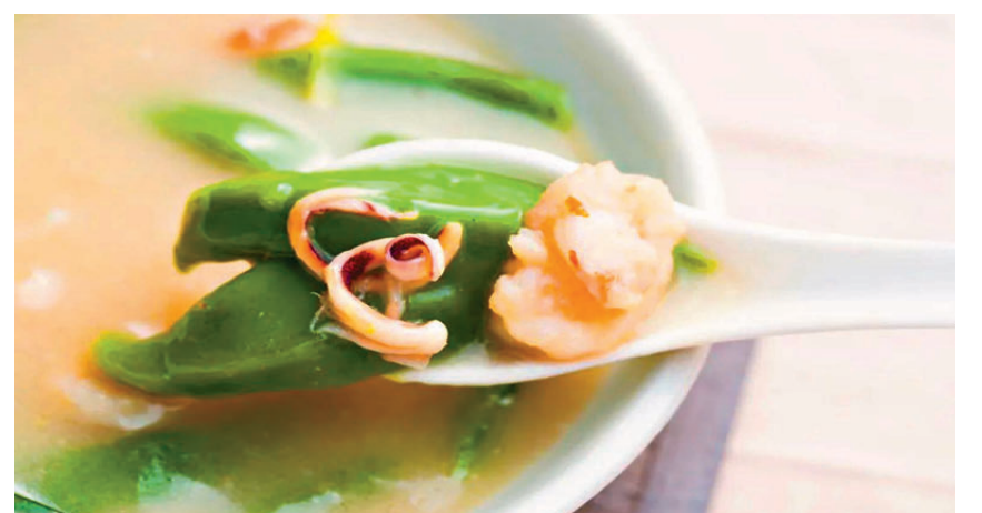
●圖為大鵬綠丸仔，是米或混入糯米和綠葉蔬菜的綠色湯圓。 資料圖片

●葉德平博士，香港教育大學「文化傳承教育與藝術管理榮譽文學士」課程統籌主任、「戲曲與非遺傳承中心」副總監，曾出版多本香港歷史、文化專著。