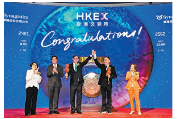
獅騰控股昨掛牌上市,成為香港首宗成功完成併購交易的案例。

另外,內地綜合出行平台活力集團正式遞表申請在港上市。招股書顯示,公司主要通過經營航班管家及高鐵管家應用程式,為旅客提供一站式服務,今年上半年純利按年跌6%至2,894.6萬元(人民幣,下同),同期收入按年升22.6%至2.81億元。據弗若斯特沙利文的資料,活力集團去年總交易額為308億元,在內地一站式綜合出行平台中位居第二。截至今年6月底,公司所有平台的註冊用戶累計超過1.74億人。