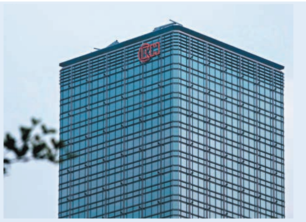
長江集團宣布進軍再生農業範疇。圖為長江集團資料圖片。

長實(1113)及長和(0001)透過長和旗下的長江生命科技(0775)(合稱長江集團)聯手進軍再生農業範疇,主要投資於儲存碳的碳封存(carbon sequestration)項目,該計劃將由長江生命科技負責管理,可將透過碳減排合同方式,售予澳洲政府或私人企業。該集團透露已收購澳洲超過35萬公頃農業用地(相當於約3.5倍香港土地總面積)的田園租約及相關權利,作碳封存用途。