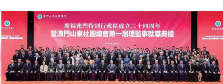
●2023年8月，澳門山東社團總會第一屆理事會就職典禮合影。