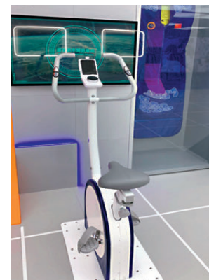
圖為愛國教育支援中心的航天基地的模擬太空單車。

航天员為了保持身體健康，需要在太空中做特別的運動，比如用拉力器和太空自行車進行鍛煉，這樣就可以幫助他們的骨骼和肌肉保持健康，所以對於航天员來說，健身是每天必備的鍛煉。