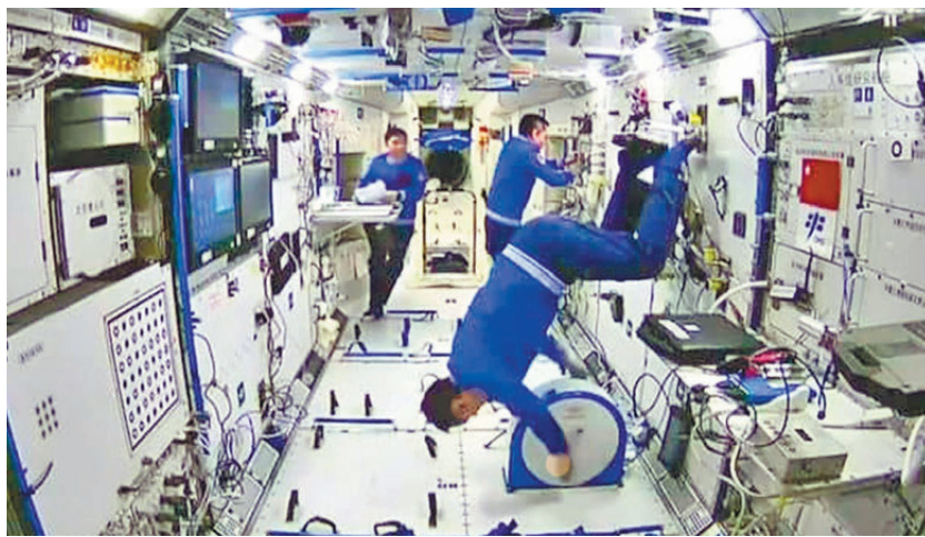
航天员聂海勝示範倒立騎車。

長時間處於失重環境狀態下，人體會相應地發生一些變化，比如心血管功能引發身體重心上移、骨質疏鬆、肌肉力量減弱等。航天醫學主要就是研究航天中的各種特殊因素對人體的影響，探討其機理及制定有效的防護措施，保證航天員在太空飛行時健康高效地工作。