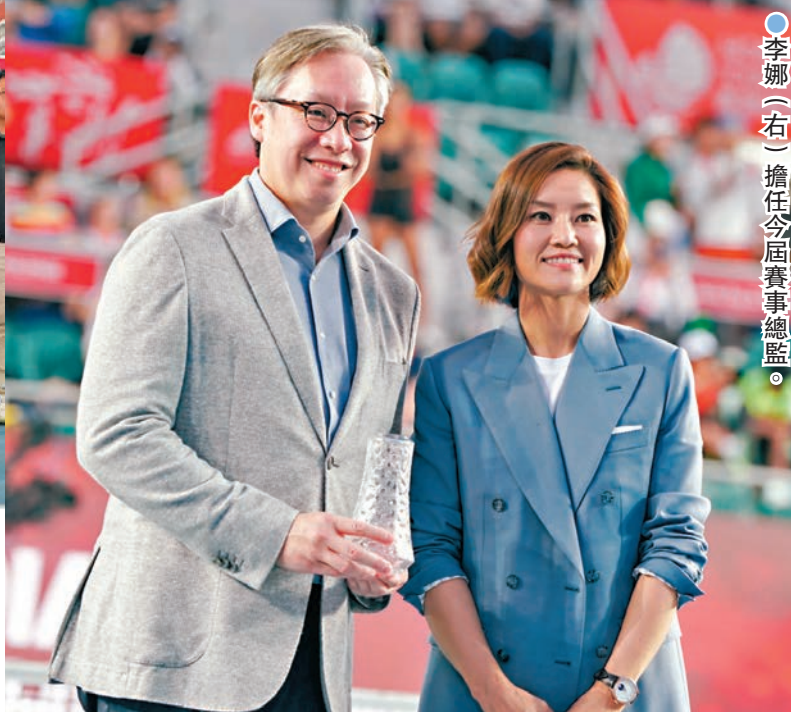
●李娜（右）擔任今屆賽事總監。

現年42歲的李娜自2018年來港出戰名人賽後，6年後再度現身。「娜姐」掛拍十年依然神采飛揚，7年來堅持日跑9公里的習慣，正是她保持狀態之道。退役後，網球仍然是其生活的一部分，今年獲香港網球總會邀請，擔任WTA香港公開賽的賽事總監，轉換角色再踏賽場。