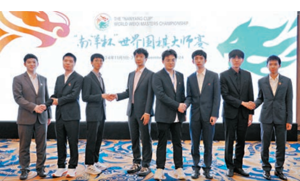
●晉級8強的棋手握手合影。

焦點戰中國棋手連笑負於韓國頭號棋手申真諤，柯潔內戰2.5目惜敗王星昊，丁浩不敵卞相壹，遺憾止步16強。最終，日本、中國台北、馬來西亞選手全部出局，6位中國棋手和2位韓國棋手攜手挺進8強。