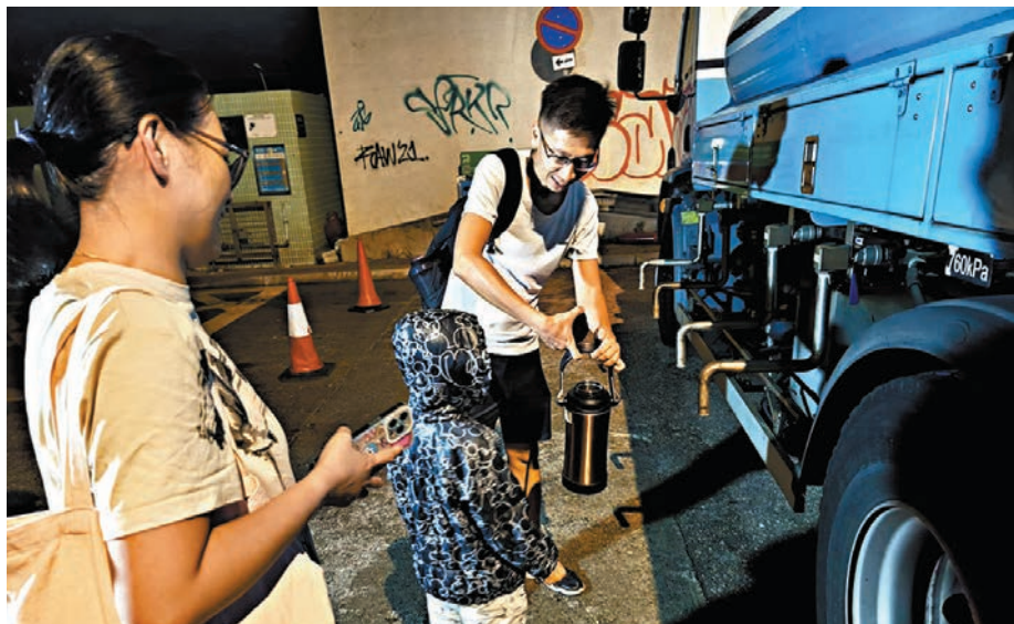
●一家大細漏夜攜同膠桶或水壺到樓下取水。