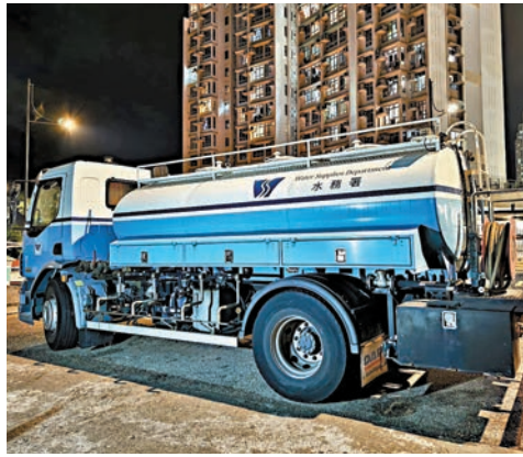
●其中一架水車停在裕泰苑。