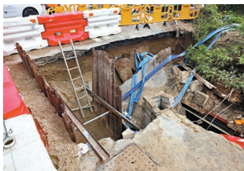
●翔東路爆水管現場已經完成修復。