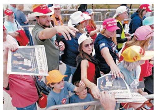
●特朗普支持者深信舞弊論。

訟。儘管許多訴訟已被駁回，但觀察人士擔心，這類案件可能進一步擾亂民眾對今年選舉的認知，尤其特朗普堅持重復不實主張，聲稱他在2020年大選的勝利被盜竊。