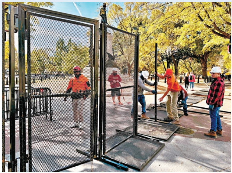
●華盛頓當局工作人員在在白宮附近設置金屬圍欄。

香港文匯報訊 美國大選周二(11月5日)迎來投票日，但爆發暴力事件的擔憂不斷增加。美國《華盛頓郵報》報道，各地官員已加強與選舉相關場所的安全，包括在屋頂部署狙擊手以保護點票總部、為選舉工作人員發放緊急按鈕，以及安排無人機監察。負責認證亞利桑那州選舉結果的州務卿甚至表示，他已身穿防彈背心，防止遭到襲擊。