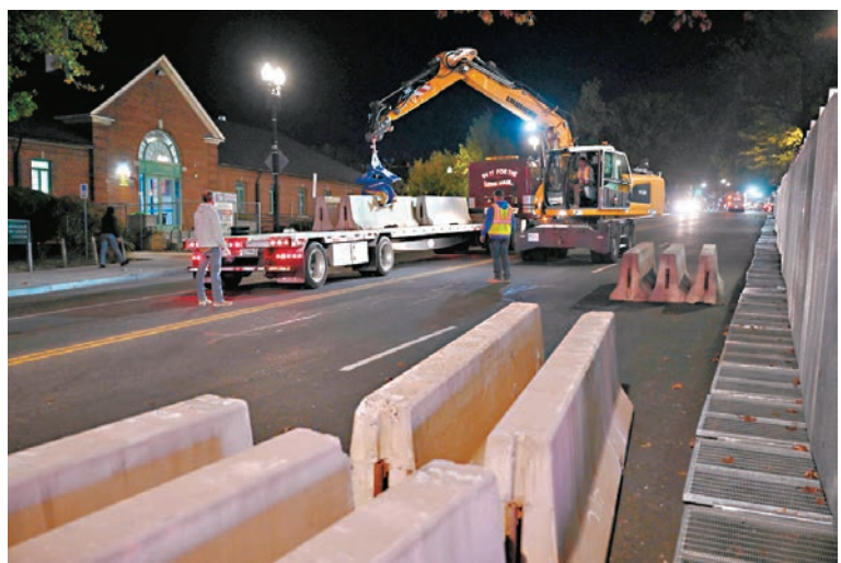
●哈里斯投票日將待華盛頓霍華德大學，當局在校外放置石壘。

華盛頓州和俄勒岡州的票箱早前被縱火，聖安東尼奧的票站工作人員則遭人襲擊，美國現時已風聲鶴唳。北卡羅萊納州選舉委員會在10月底收到一個包裹，但因重量過重，懷疑當中並非選票，因而引發恐慌，但最終發現裏面只是感謝信。