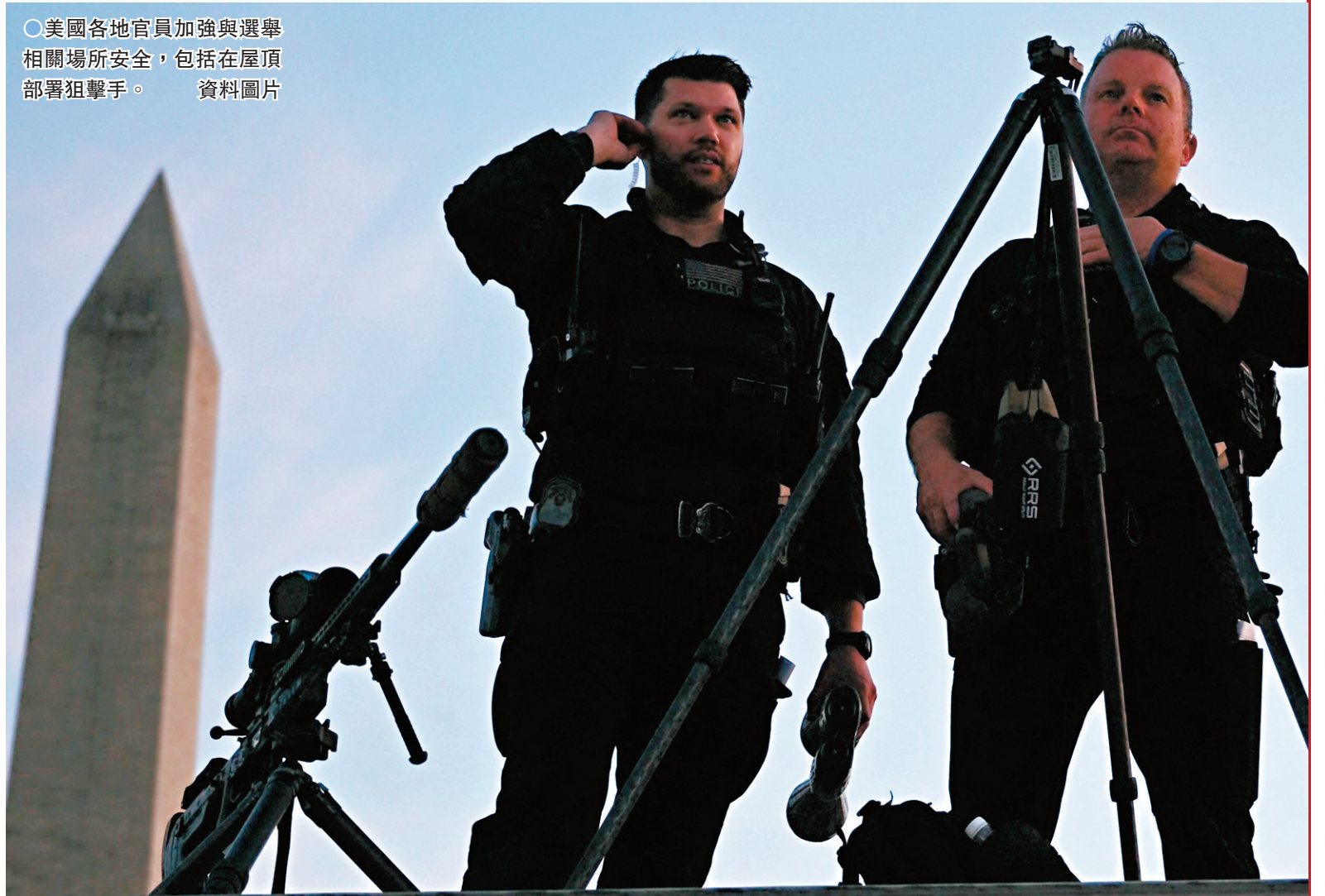
○美國各地官員加強與選舉相關場所安全，包括在屋頂部署狙擊手。