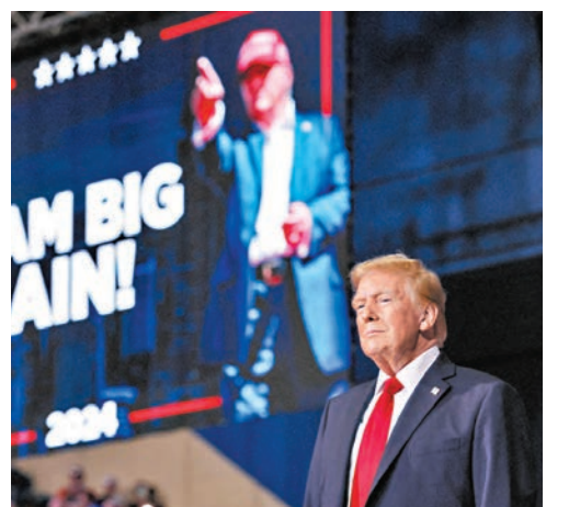
●特朗普在電話訪問中口快承認可能敗選。 資料圖片

特朗普同日在賓夕法尼亞州利蒂茨的造勢活動上再散播「選舉舞弊論」，表示在輸掉2020年那場他尚未承認的大選後，他不應在2021年離開白宮，「在我離開的那天，我們國家邊境是歷史上最安全的。我不應該離開，我的意思是，我們做得很好。所以現在，每個投票站都有數百名律師站在那裏。」