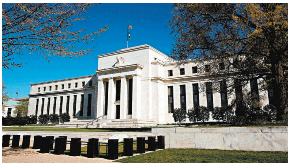
●有分析認為，美國大選結果或將成為市場對於2025年聯儲局減息周期預期的最大變數。圖為聯儲局大樓。資料圖片

時，尋找機會策略性地增加存續期風險，或在其他G10國家債券市場增加存續期，因為這些市場的降息周期較淺，並已在近期市場中反映。