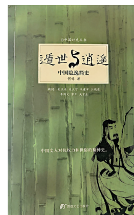
歷來隱士，此書例證多。

至如「酒隱」則不用說了，因為，無財何來「酒隱」？「道士隱」「佛徒隱」如無信徒恭奉，何能「隱」？若問各種「隱」之中，閣下喜哪種？「學隱」也，但要達此，談何容易哉！一言以蔽之，要「隱」無財不行也。