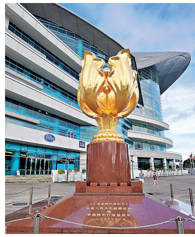
中央政府贈送特區政府的《永遠盛開的紫荊花》雕塑屹立在維港畔。

二是與世界的聯繫。自古以來，香港就是中國內地對外交通的門戶，亦是西方了解中國的窗口，進入中國的通道。優越的地理位置和自由港政策，使香港發展成為具有全球影響力的國際金融、航運、物流中心。互聯互通是香港與生俱來的基因，作為地理上的交匯地，文化上的交融地，意識形態上的交匯地，積累了豐富的與不同國家和地區打交道的經驗，形成了濃厚的對各種新事物新觀念開放包容的風氣。香港還是有名的美食天