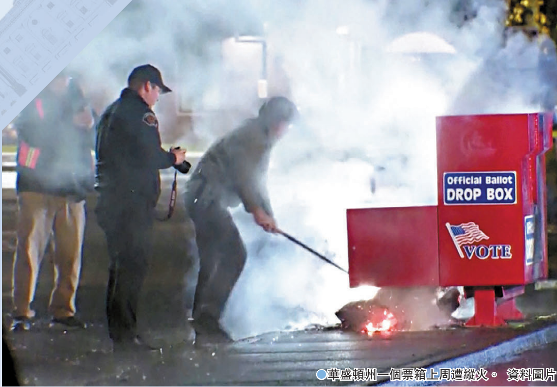
華盛頓州一個票箱上周遭縱火。資料圖片