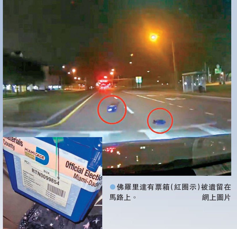
佛羅里達有票箱(紅圈示)被遺留在馬路上。