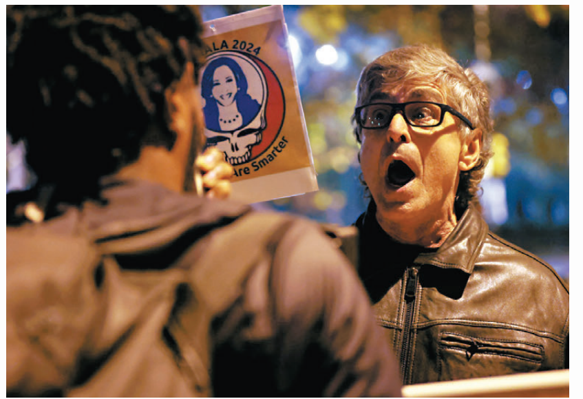
多地發生紅藍支持者在街頭對罵。資料圖片