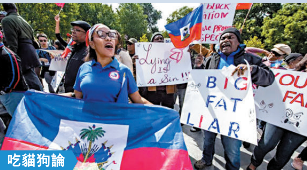
吃貓狗論 特朗普稱海地移民吃貓狗，觸發海地群體抗議。