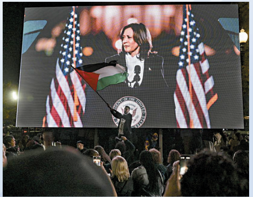
美國政府首撐以色列觸怒國內穆斯林，由於哈里斯被認為將延續拜登政策，大批穆斯林呼籲拒投哈里斯。資料圖片