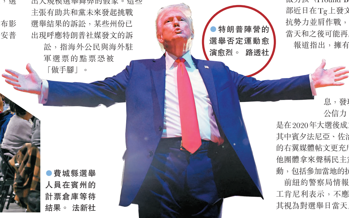
特朗普陣營的選舉否定運動愈演愈烈。

該報分析指出，馬斯克的X平台與特朗普名下社媒Truth Social，令選舉舞弊論的支持者在過去幾年找到發揮影響力的空間。他們已發展出快速反應機制，能迅速傳播有關選舉異常狀況的謠言，營造出大規模選舉舞弊的假象。這些主張有助共和黨未來發起挑戰選舉結果的訴訟，某些州份已出現呼應特朗普社媒發文的訴訟，指海外公民與海外駐軍選票的點票恐被「做手腳」。