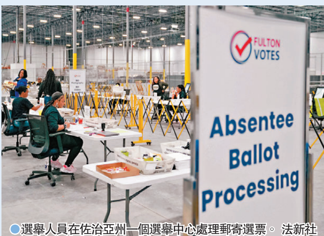
選舉人員在佐治亞州一個選舉中心處理郵寄選票。

領先特朗普14個百分點，是民主黨重要票倉之一。但郵寄選票在當年成為極具爭議的選舉問題，特朗普陣營當時強烈懷疑許多郵寄選票，是在投票結束後被製造出來，讓拜登翻盤。