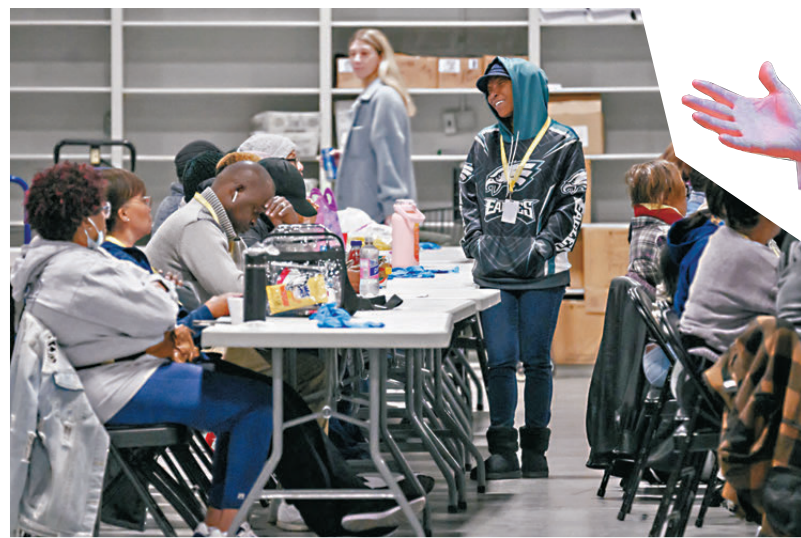
費城縣選舉人員在賓州的計票倉庫等待結果。