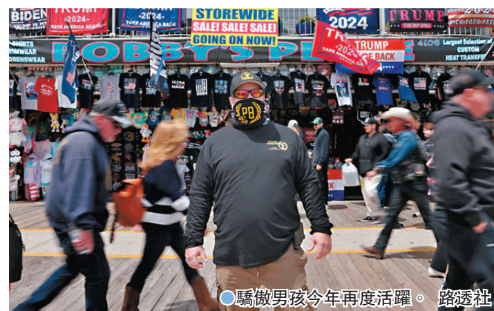
驕傲男孩今年再度活躍。

香港文匯報訊 隨着美國大選到來，支持共和黨總統候選人特朗普的極右團體，近日在通訊軟件Telegram(Tg)號召支持者在親民主黨選區監督投票，一些人甚至貼出持槍揮舞權力的圖片來招募同路人，準備質疑選票有效性。其他人則散播陰謀論，聲稱若特朗普無法勝選，就是嚴重的不公，應發動叛亂。