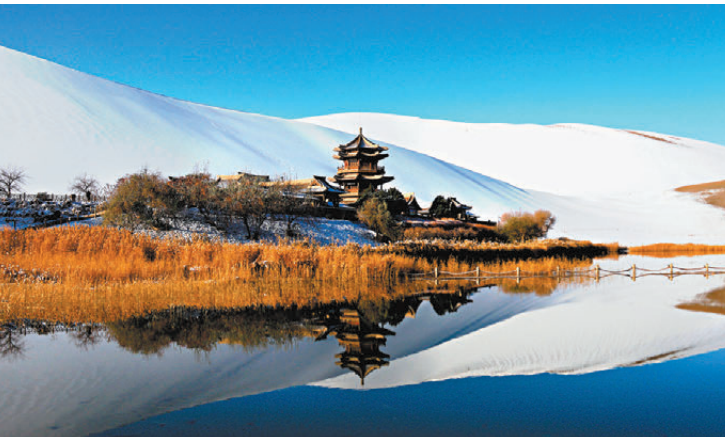
圖為雪後的鳴沙山月牙泉景區。資料圖片