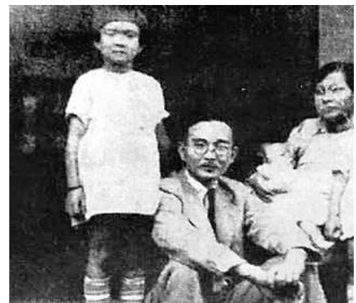
圖為林語堂(左二)一家合影。

而互相爭鬥，但這一切在戰爭這個大背景中，都顯得那麼渺小。就如作者所說：「戰爭就像大風暴，掃着千百萬落葉般的男女和小孩，讓他們在某一個安全的角落躺一會兒，直到新的風暴又把他們捲入另一旋風裏。因為暴風不能馬上吹遍每一個角落，通常會有些落葉安定下來，停在太陽照得到的地方，那就是暫時的安身所。」