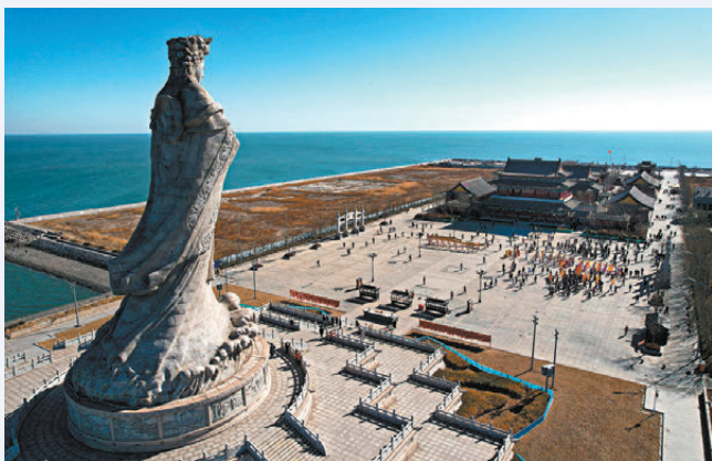
媽祖是沿海人民的守護神，圖為天津媽祖文化園中的媽祖雕像。

【按：現存最早的天后廟銅鐘是鑄造於康熙23年(1684)，現存於元朗屏山鯉魚山天后宮，但銅鐘的年份不一定能作準，因為很多時會有人從其他地方移駐銅鐘、香爐、鼓等到廟中。另外，有一說法指「天后」之封是在康熙朝已有，但筆者不同意，並曾在華人廟宇委員會公開講座中引第一歷史檔案館的《康熙起居注冊》說明。】