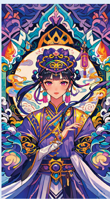
● AI國潮創作：九紫離火元素

隨着時間推移，三元九運理論的發展與戰國時期的五行學說密切相關。五行學說認為宇宙間的萬物都可以歸結為木、火、土、金、水五種基本元素，這五種元素之間存在着相生相剋的關係。五行學說為三元九運的理論