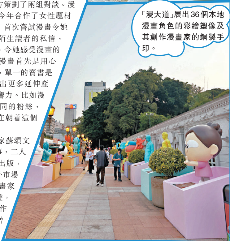
「漫大道」展出36個本地漫畫角色的彩繪塑像及其創作漫畫家的銅製手印。