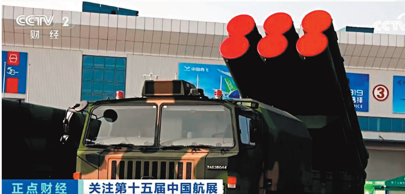
亮相珠海的紅旗-19系統集成在8×8越野車上，讓其隨時隨地都能執行在複雜電磁環境下的防空反導任務，可攔截中遠程彈道導彈和高超音速導彈。

也有國防分析人士指出，紅旗-19導彈筒高度為7.8米，這些導彈使用陡峭角度冷發射系統發射，這一功能可以減少發射器的壓力，並在交戰期間提供更高的生存能力。借助本屆航展，中國公開展示紅旗-19導彈防禦系統，亦展現中國在防空反導領域的「底氣與自信」。可見，如今中國不僅有用來遠程攻擊的「矛」，譬如中遠程彈道導彈和洲際導彈以及高超音速導彈，還有攔截彈道導彈等來襲的強大的「盾」。而相比今次公開展示的紅旗-19，該人士透露中國人民解放軍裝備已有防空反導性能更為強悍的紅旗-26，標誌着中國已經擁有了攻防兩相宜的作戰體系。