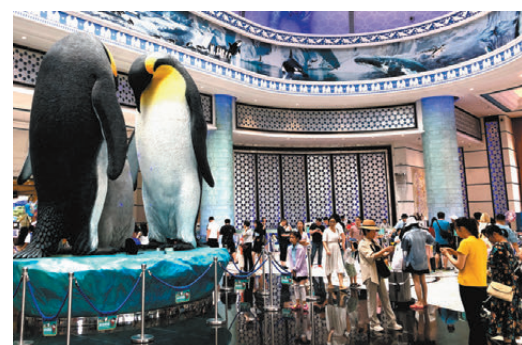
「航展+主題樂園」等航展主題遊玩法持續創新。圖為遊客在珠海主題樂園酒店遊覽。

為留住航展客，珠海市在11月啓動第四屆珠海藝術節，從專業劇院到街頭巷尾，文藝盛宴陸續上演。而「航展+主題樂園」「航展+溫泉」「航展+海島」等航展主題遊玩法亦持續創新。全球最大海洋主題公園「珠海長隆海洋王國」、橫琴創新方旅遊區、圓明新園等主題園區持續出招，其中，圓明新園攜手「珠海中醫藥一條街」攜客，橫琴創新方則推出「探月VR科技科普親子工作坊」。