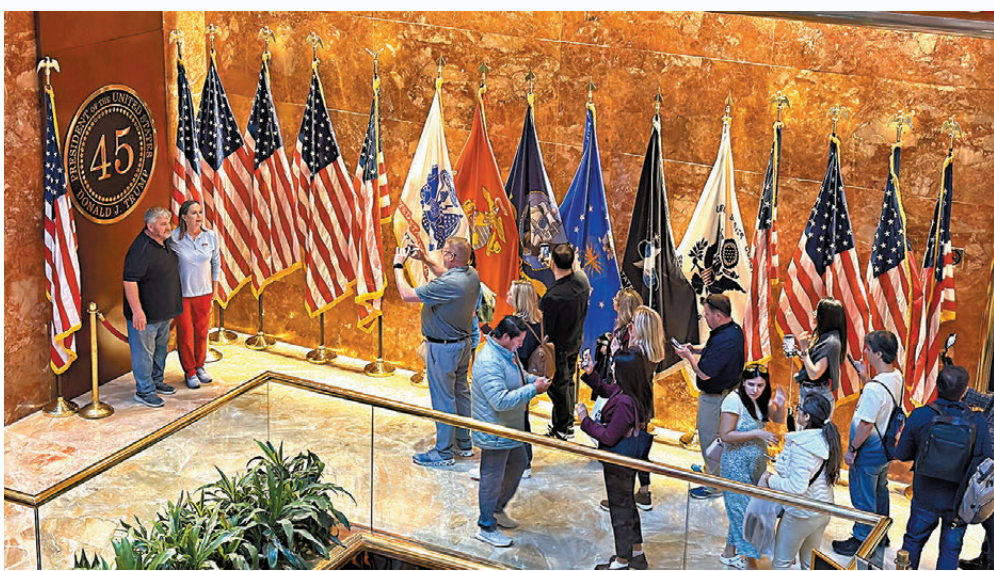
●到特朗普大廈打卡的支持者絡繹不絕。

與Thad一樣同樣感到悲傷的還有Coyle，他也投了哈里斯。面對特朗普當選的結果，他覺得美國在道德上正在分崩離析。他認為美國人這次很失敗，選了一個沒有願景的「罪犯」來當總統。Coyle分享到，過去特朗普曾多次試圖廢除「奧巴馬醫保」和《可負擔醫療法案》，而今次他可能「得逞」，有5,000萬人將失去醫保，其中大部分是支持特朗普的人，「這會成為一個教訓。」