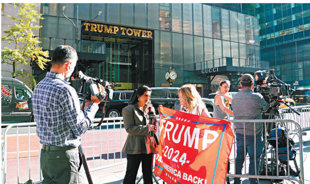
●特朗普粉絲在大廈外慶祝勝選，並接受傳媒採訪。

「這個國家的道德走向變得很糟糕，我們如今毫無方向。」Coyle對自己的國家感到悲哀，特朗普能當選，贏得普選票，說明現在的底線標準已經降得很低，大家也能接受，「身為美國人，這讓我很難過」。