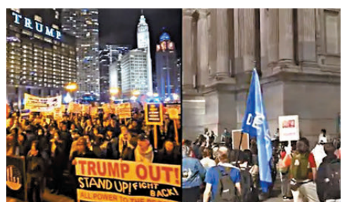
●巴勒斯坦支持者走上芝加哥街頭抗議，舉起「權力還給人民」等標語。

香港文匯報訊 美國前總統特朗普在今屆大選勝出後，據哥倫比亞廣播公司(CBS)報道，巴勒斯坦支持者周三(11月6日)走上芝加哥街頭抗議，其間還舉起「權力還給人民」等標語，要求「特朗普滾出」。報道稱，抗議行動由「美國巴勒斯坦社區