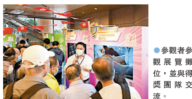
●參觀者參觀展覽攤位，並與得獎團隊交流。

「創客中國」國際中小企業創新創業大賽香港分站賽是一項由數字辦聯同國家工業和信息化部中小企業發展促進中心、中央政府駐港聯絡辦青年工作部及中國中小企業國際合作協會聯合舉辦的創科比賽，目的是推動中小企業創科發展。是次成果展為慶祝中華人民共和國成立75周年的活動之一，讓市民感受國家和香港的創科發展。