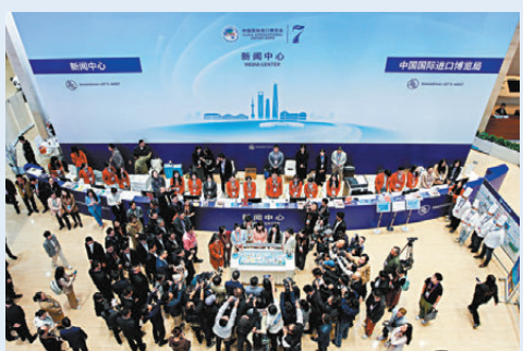
11月8日是第25個中國記者節，第七屆進博會新聞中心舉辦多項活動，為媒體記者慶祝屬於他們的節日。