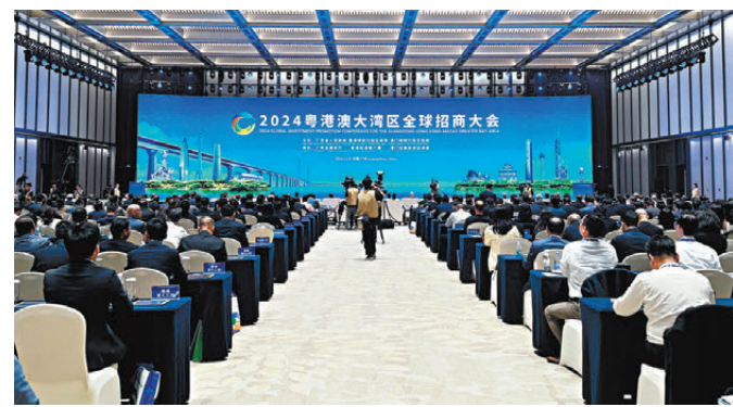
8日，2024粵港澳大灣區全球招商大會在廣州舉行。現場共達成簽約項目1,933個、資金總額2.26萬億元人民幣。