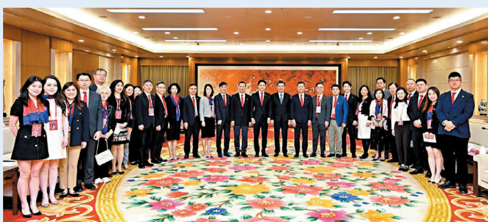
11月7日，廣州市委書記郭永航在廣州會見了港區省級政協委員聯誼會訪問團一行。

港區省級政協委員聯誼會主席蘇清棟表示，聯誼會願作為廣州引進資源和向外拓展的橋樑和紐帶，為廣州發展多聚智慧力量，為粵港澳大灣區建設的共同目標，深入推進穗港人才合作，努力使香港和國外的先進科技向廣州延伸。同時把聯誼會的資金、技術、海外合作等資源與廣州的發展結合起來，在科