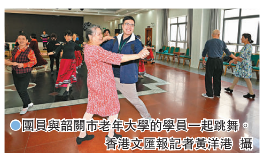
團員與韶關市老年大學的學員一起跳舞。

在韶關老年大學，團員們不僅親眼見到長者們的學習環境，更親身體驗學習歌唱、舞蹈的課堂，來自香港的社福界同工與內地長者手牽手，在歡快的歌曲中跳起交誼舞，還共唱粵語歌曲《萬水千山總是情》，大家載