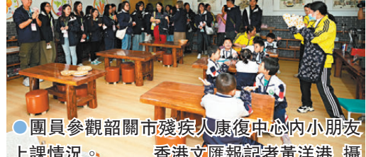
團員參觀韶關市殘疾人士康復中心內小朋友上課情況。

歌載舞，氣氛輕鬆愉悅。昨日下午，交流團還前往乳源瑤族自治縣雕子塘村，感受當地特色民族文化，如體驗長桌宴、品嚐艾草粿等特色美食。大多數團員都是首次到韶關，大家都說，透過這兩天的走訪感受到韶關市民的熱情與禮貌，大家在輕鬆愉快的環境下學習交流，增廣見識，收穫很大。