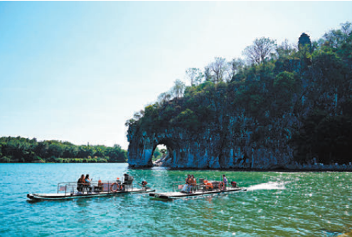
遊客在廣西桂林市象鼻山景區乘船遊玩。