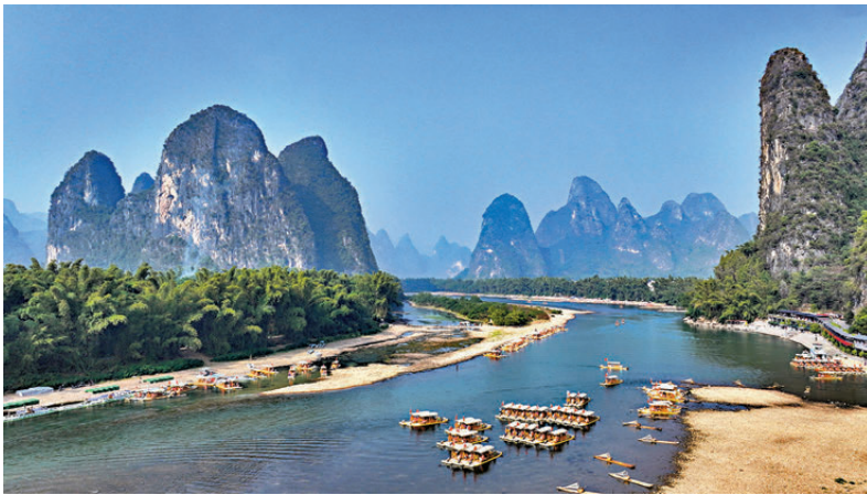
廣西桂林市陽朔縣興坪鎮拍攝的漓江風光。