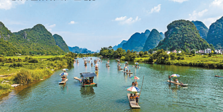
遊客乘坐竹筏在漓江上遊覽。