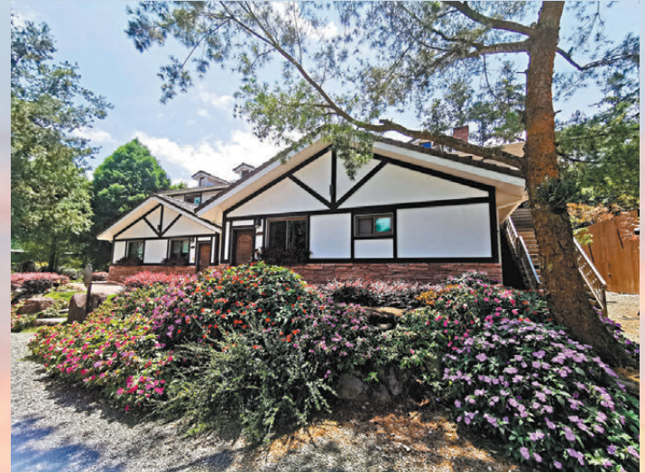
悠森境渡假村瀰漫着歐式鄉村風格