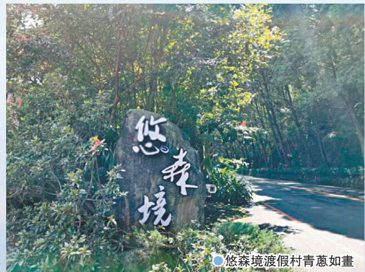
悠森境渡假村青蔥如畫

渡假村內的飲食採用自主管理，森居食堂內自己碾米、烹煮，還有食材也都是選用地生產為主，餐桌上的菜單隨着四季變化而變化，每日供應的魚類來自花東縱谷的立川漁場，另選取來自新竹只吃玉米與天然牧草的玉米雞，以及依照四季時令挑選的鮮採蔬果。