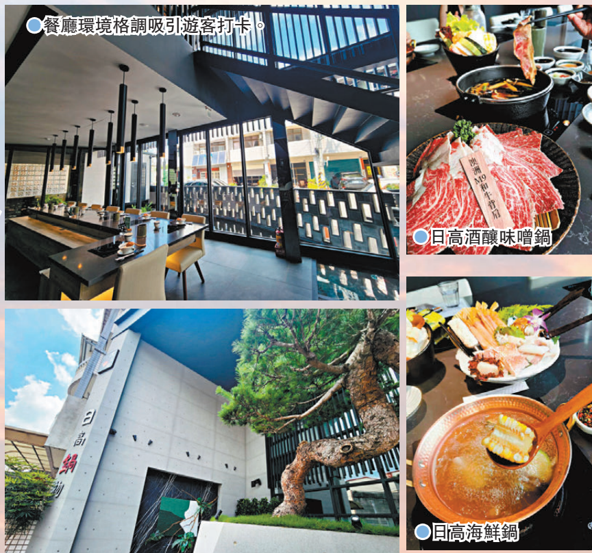
餐廳環境格調吸引遊客打卡。

網址： https://www.facebook.com/Hidakahotpot