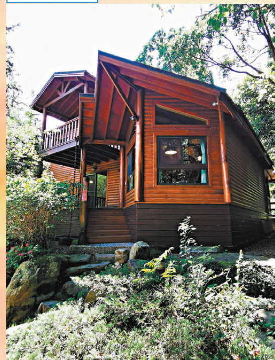
全屋以檜木設計，散發着檜木的香氣。