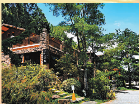
悠森境咖啡廳及餐廳