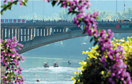
桂林市陽朔縣城漓江大橋，遊客乘坐竹筏遊覽漓江。