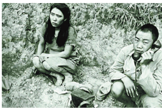
●松山戰役中被俘的朝鮮慰安婦。

第56師團中序列第一的第113聯隊也是一支很不尋常的部隊。第113聯隊於1938年5月在日本熊本編成，最初納入第106師團序列參加了武漢會戰，在九江以南的沙河鎮和萬家嶺，兩次幾乎被國民黨軍全殲，其首任聯隊長田中聖道大佐被擊斃；在一年後的南昌會戰中，繼任聯隊長飯野賢十次大佐又被打死。1940年3月該聯隊被撤編，兵員解散。半年後，第113聯隊又在日本福