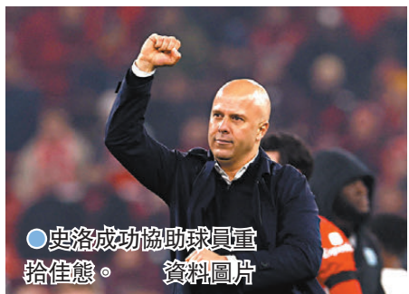
●史洛成功協助球員重拾佳態。

本以為功勳主帥高洛普離隊後利物浦將會踏入漫長的重建階段，不過新帥史洛卻在短時間內贏盡球迷歡心，帶領球隊近12場正式比賽豪取11勝1和，開季至今只曾輸過1場，標誌着史洛時代的「紅軍」正式降臨。無可否認高洛普遺留下來的班底仍屬英超頂尖，但史洛作為一位名氣不大的領隊，要迅速走出高洛普的陰影，獲得高層、球員以至球迷的信任卻非易事，他務實低調的風格成為了質疑聲音最有力的回應。史洛麾下的利物浦或許少了往日的激情四射，卻擁有更強的穩定性和戰術紀律。此外，這位荷蘭籍主帥亦擅長激發球員潛力，多名球員在今季煥發新生，減低了利物浦引援不力的影響。居迪斯鍾斯正是史洛上任後的最大受益者。這位英格蘭中場本是被寄予厚望的新星，但近年進步甚微不時成為球迷批評的目標，直至今季此子終於迎來大爆發，在人才濟濟的「紅軍」中場穩佔一席，除了對車路士射入致勝入球，近兩場亦送上美妙助攻，成為攻守兼備的中場悍將。史洛讚鍾斯成長肯努力 冀續改進