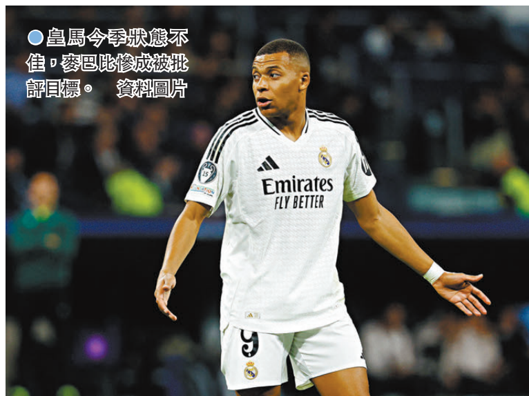
●皇馬今季狀態不佳，麥巴比修成被批評目標。

香港文匯報訊(記者 郭正謙)皇家馬德里今季有法國巨星麥巴比加盟，但戰績卻令人失望，聯賽已落後榜首巴塞隆拿9分，今仗主場對奧沙辛拿已再無失分空間。在球會表現平平的麥巴比於國家隊亦受到抨擊，新一份法國國足名單他再次榜上無名，雖然主帥迪甘斯已表明是自己的決定，但外界仍質疑麥巴比是漠視國家隊徵召。如果麥巴比未能及時重拾狀態，勢將遭遇更龐大的輿論壓力。(Now632台今